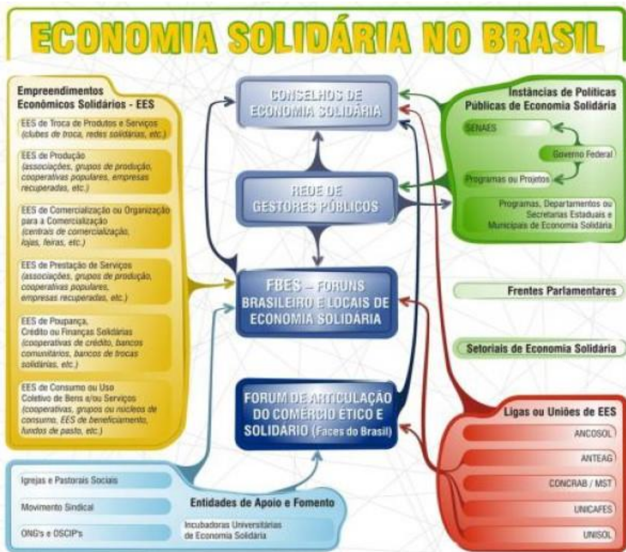
Figura 1: A economia solidária no Brasil