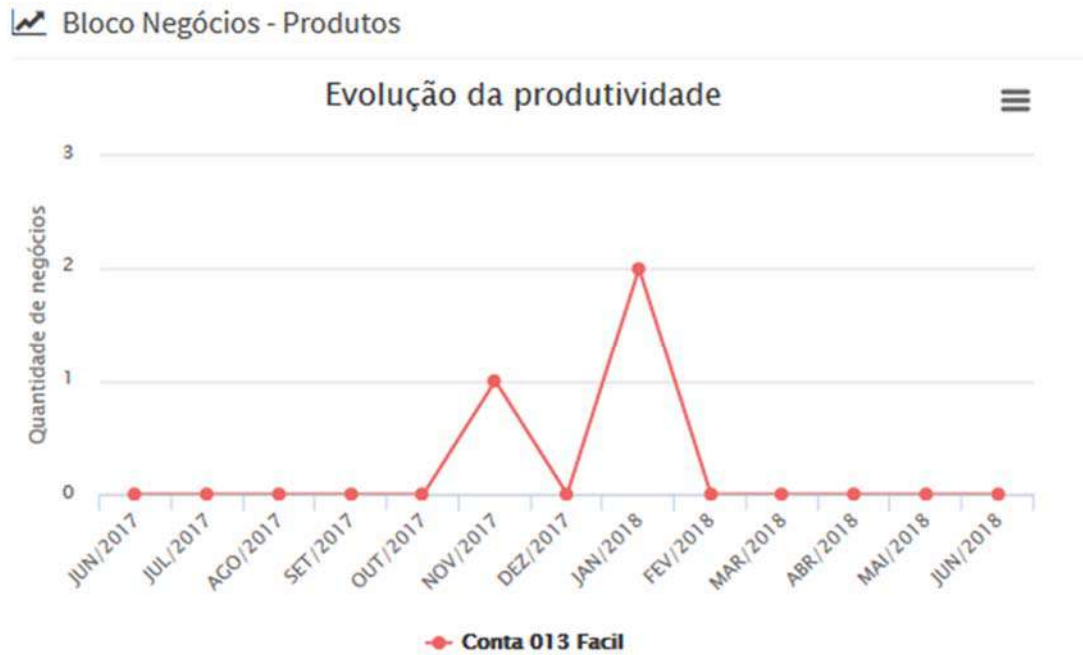
Figura 6: Abertura de contas poupanças.