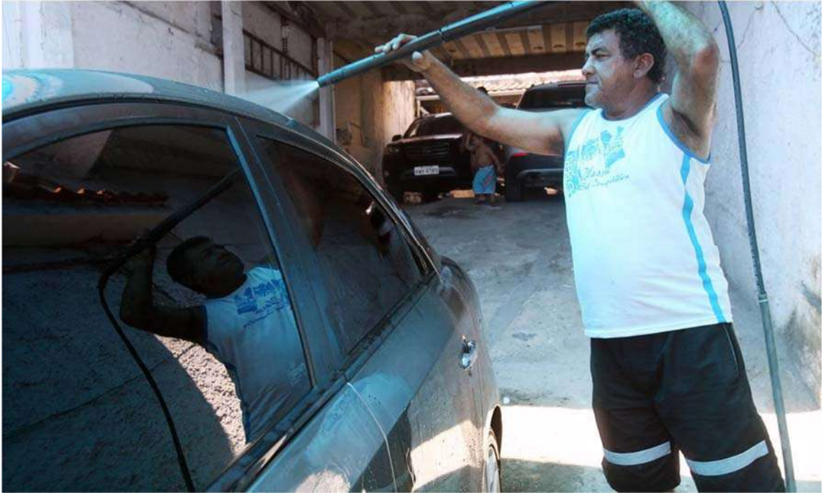
Figura 2: Prestador de serviço local tomador de microcrédito produtivo.