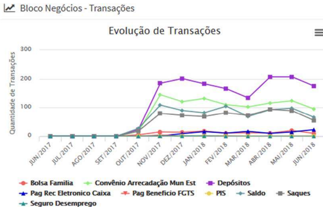
Figura 7: Quantidade transações.