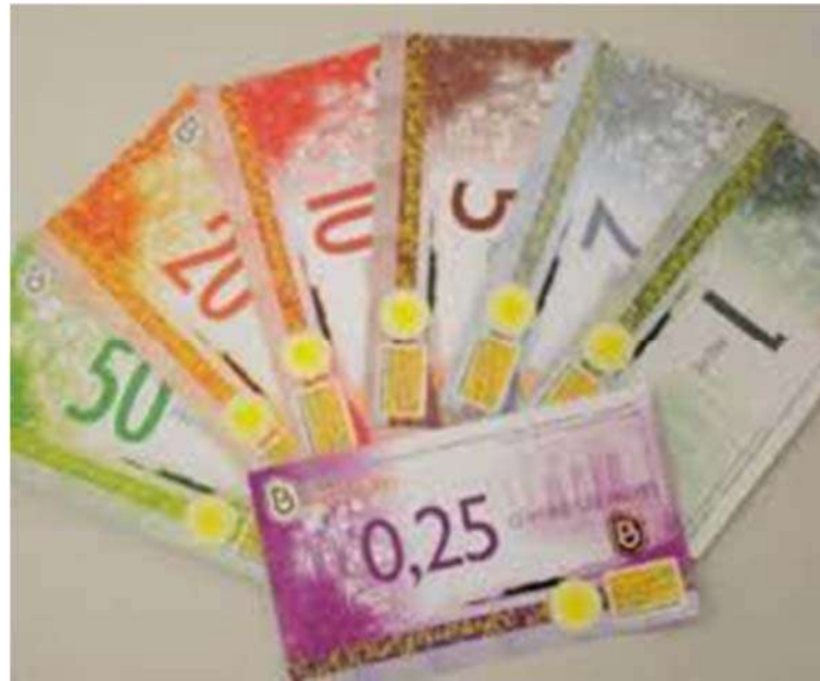
Figura 1: Moeda social Prevê.

extrema importância para o sucesso deste instrumento.