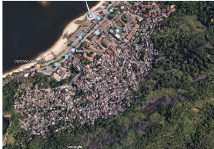
Figura 4: Morro do Preventório visto de cima pelo Google.

O nome do bairro de Charitas origina-se do latim e tem como significado a palavra caridade. Em 1853 foi fundado o hospital Naval de Santa Isabel pelo Sanitarista Francisco de Paula Cândido. O casarão histórico foi construído para presentear a princesa Isabel de Bragança e Bourbon pelo seu aniversário e, com o passar do tempo, foi chamado de Preventório Paula Cândido – visto que se tornou uma casa onde pessoas com doenças contagiosas aguardavam tratamento e previamente eram afastadas da convivência com outras pessoas para evitar epidemias. Seu uso e função foi modificado várias vezes - foi hospital naval, Preventório 22 para pessoas com doenças contagiosas, internato para adolescentes em risco social e, atualmente, um Colégio Estadual Matemático Joaquim Gomes Souza - Intercultural Brasil China. O Preventório Paula Cândido foi dando nome ao local e os próprios funcionários passaram a morar nas proximidades e, na década de 1980, pessoas de vários estados foram morar no morro.