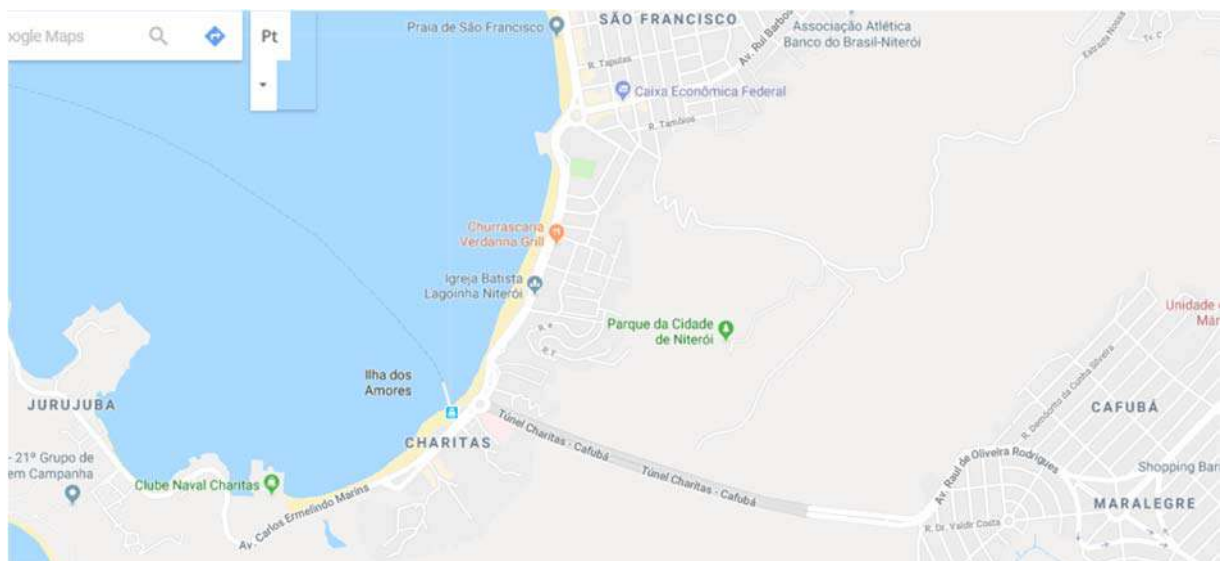
Figura 3: Mapa visto pelo Google indicando a ligação de Charitas pelo Túnel até o Cafubá.

O Preventório é uma favela de baixa renda da cidade de Niterói, Rio de Janeiro. Formou-se nos anos 1980, principalmente com a ocupação de parte do Morro da Viração, um grande maciço de pedra, em área de mata atlântica, de frente ao mar. O morro está inserido dentro do bairro de Charitas, área nobre com moradias de alto luxo, sendo identificadas como uma das áreas mais caras para se morar do estado do Rio de Janeiro e de alto interesse do mercado imobiliário e turístico.