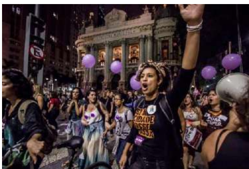
FIGURA 2 – Marielle Franco durante protesto na Cinelândia, RJ.

Grupos de esquerda tem sido criminalizados e manifestações populares nas ruas tem sido duramente reprimida pela polícia. Neste sentido, a violência contra ativistas e militantes de esquerda talvez tenha atingido seu ápice com a execução da vereadora Marielle Franco – mulher, negra, homossexual e socialista (FIGURA 2) –, em 2018. Este crime desumano e contra a democracia ocorreu em plena intervenção militar no Estado do Rio de Janeiro. Evento de repercussão mundial que, parafraseando a Federação Anarquista do Rio de Janeiro, consiste em mais uma experiência do “laboratório do inferno neoliberal” que se transformou o Rio de Janeiro.