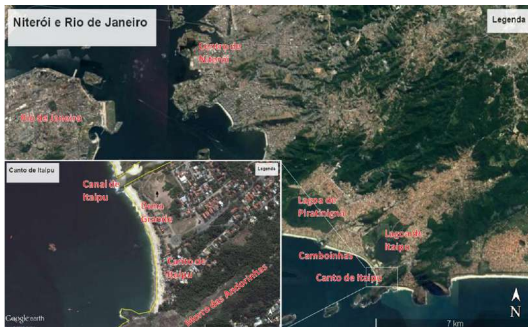
FIGURA 6 – Mapa de localização do Canto de Itaipu.

pesca conhecida como “arrastão” 21 , que ainda guarda inúmeras semelhanças com a forma como era organizada décadas atrás. Pela importância desta tradição as atividades de pesca artesanal no Canto de Itaipu foram tombadas como patrimônio cultural imaterial do município.