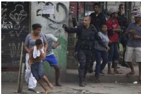
FIGURA 1 – Policial dispara spray de pimenta contra mulheres e crianças que protestavam em Manguinhos pela morte de uma criança de 8 anos durante um tiroteio.

318 mil jovens, uma sangria que marca este país e compromete nosso desenvolvimento. Perguntamos que efeitos são produzidos na massa trabalhadora das periferias ao se depararem com esta realidade?