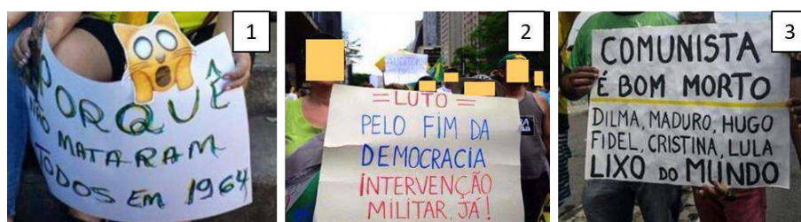
FIGURA 5 – Tríptico fascista.

Estes discursos mal fundamentados, contraditórios e antidemocráticos legitimam e favorecem a amplificação de posições ultraconservadoras e antidemocráticas na sociedade, como pudemos observar em diferentes manifestações pró-impedimento e anti-PT (FIGURA 5).