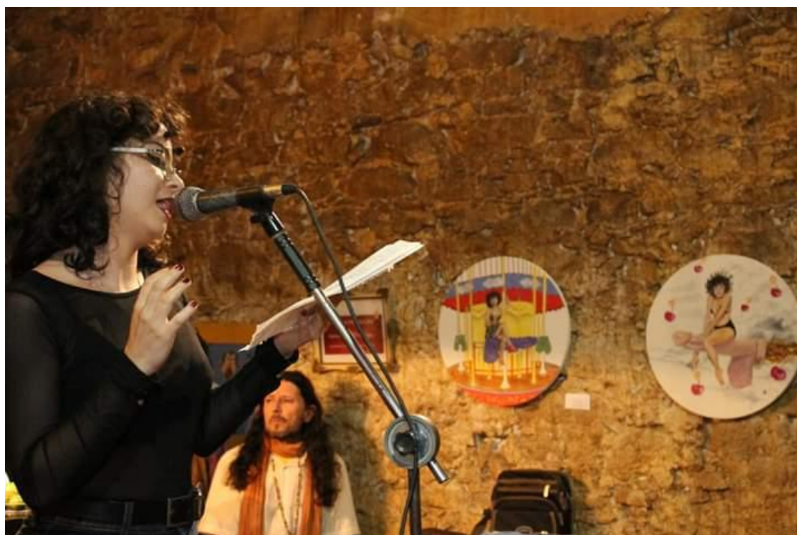
Foto da minha Participação recitando e expondo no Sarau D4, evento de arte erótica que ocorreu em 2019 no Palco Lapa 145.