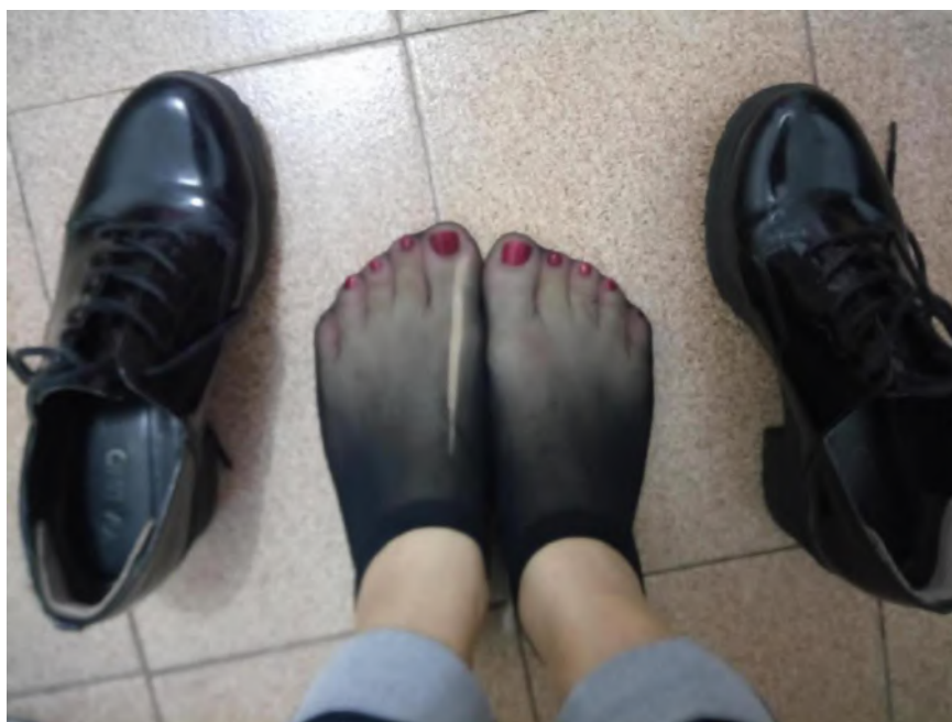
Foto tirada por mim por volta de 2019, reflete o voltar-se para si.