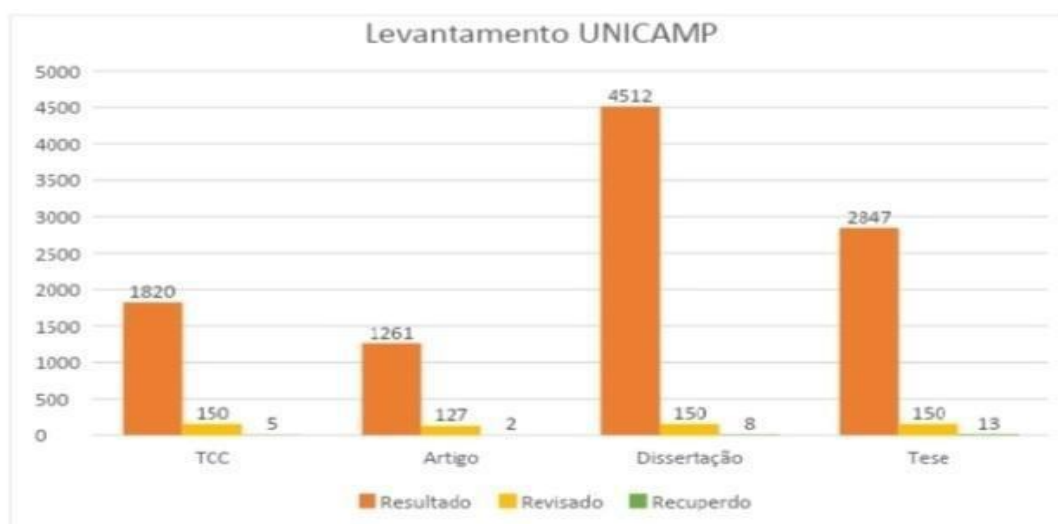
Gráfico 1. Levantamento Unicamp

Com objetivo de levantamento de dados que apresentem a Wikipédia como fonte nas publicações acadêmicas e científicas, foram coletados nas bases de dados da Universidade Estadual de Campinas (Unicamp) e da Universidade Federal do Rio de Janeiro (UFRJ) (cf. Gráficos 1 e 2). Ambas, fontes informacionais de assuntos técnico científicos com ampla credibilidade na comunidade científica. No primeiro momento, a palavra Wikipédia foi pesquisada de forma genérica, desta forma, constatou-se o uso do termo em numerosos textos que tenham o título, que tenham o resumo ou presentes nas palavras-chave de resumo. Esse quantitativo é justificado na medida que os itens recuperados compreendem o assunto, entretanto, esse não é o objeto desse levantamento. Após pesquisa bibliográfica inicial, a escolha dos critérios de avaliação para a presente pesquisa perpassou pelo descritor: Wikipédia como fonte, e pelo recorte temporal (dos anos de 2018 a 2022). As buscas nas comunidades repositórias visaram as publicações científicas (livros e artigos), trabalhos acadêmicos (TCC e monografia), teses e dissertações.