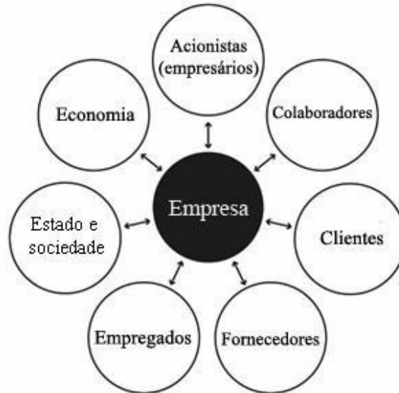
Figura 2 – Relação entre os stakeholders e a empresa

Fonte: Adaptação do conteúdo de “What is stakeholder capitalism?”. Schwab, Modern Company Management in Mechanical Engineering , 1971.