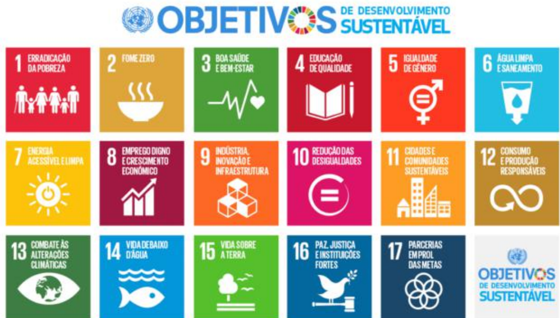
Figura 1 - Objetivos de Desenvolvimento Sustentável

Nesse mesmo viés, aprofundando muitos dos temas abordados em Brundtland, em setembro de 2015, líderes mundiais e representantes da sociedade civil, reunidos na sede das Nações Unidas, em Nova York, decidiram um plano e estabeleceram 17 Objetivos de Desenvolvimento Sustentável, conforme imagem infra, os quais deveriam ser plenamente implementados até 2030, a fim de que se atinja um mundo melhor para os povos e nações (ONU, 2015).