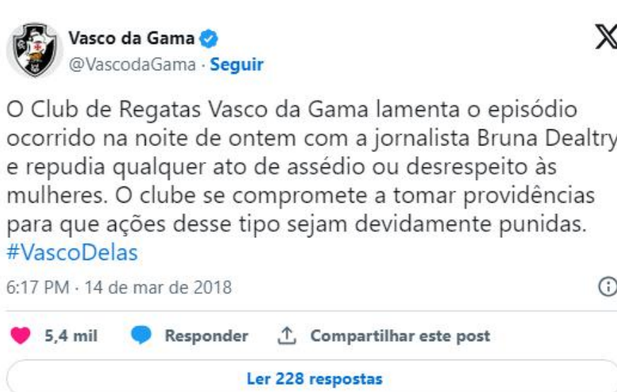
Figura 6: Nota de repúdio do Vasco da Gama