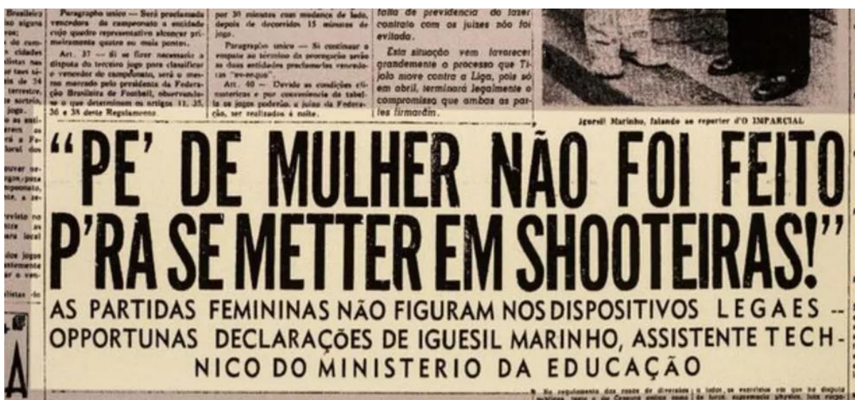
Figura 1: Jornal de 1941

Manchetes de meios de comunicação, como revistas e jornais, escancaravam essa ideia.