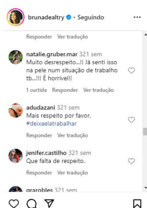
Figura 5: Comentários na postagem de Bruna Dealtry