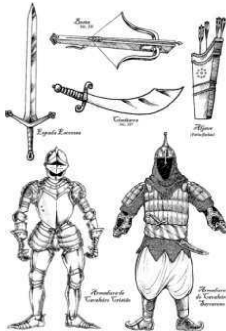
Figura 11 – Besta (séc. XII), Espada Escocesa, Cimitarra (séc. XIV), Aljava (porta-flechas), Armadura de Cavaleiro Cristão e Armadura de Cavaleiro Sarraceno

Disponível em https://amz.onl/2Q7HeRQ . Acesso em: 20 set. 2024.