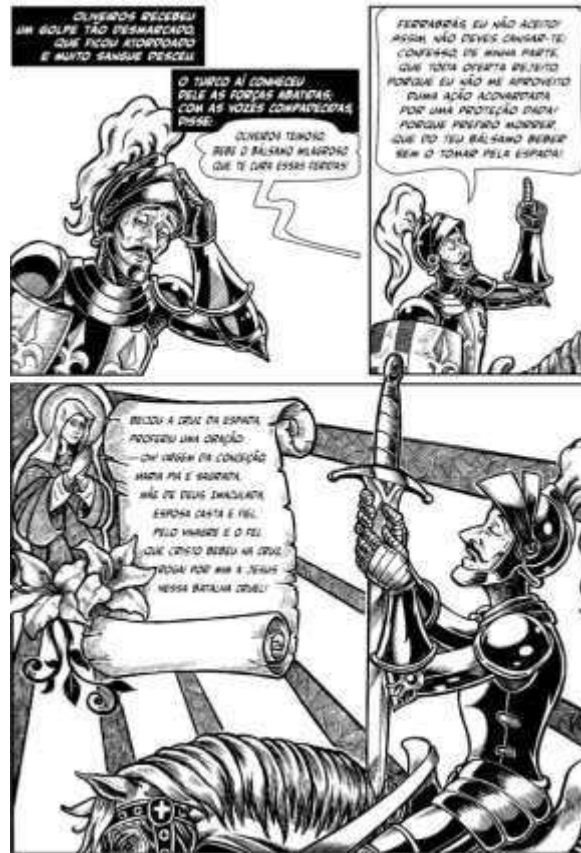
Figura 5 – Oliveiros recusa o Bálamo, beija a cruz da espada e roga à Virgem Maria proteção

Disponível em https://amz.onl/2Q7HeRQ . Acesso em: 20 set. 2024.