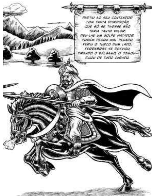
Figura 6 – Ferrabrás toma o Bálamo para curar-se do golpe matador de Oliveiros