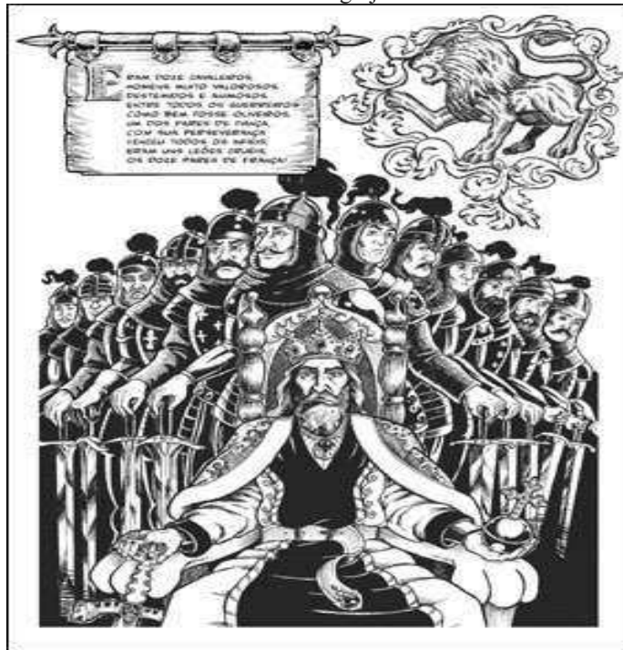
Figura 3 – Introdução: Apresentação do Imperador Carlos Magno (ao centro) e os Doze Pares de França, “Os Leões da Igreja”

Disponível em: https://universohq.com/noticias/a-batalha-de-oliveiros-com-ferrabras-cordel-classico-em-quadrinhos/ . Acesso em: 20 set. 2024.