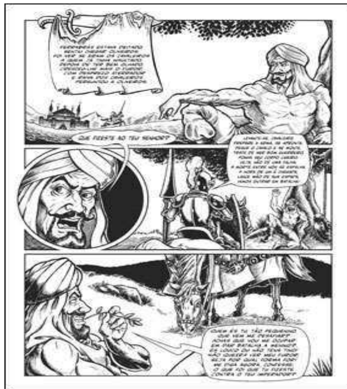
Figura 4 – Deboche de Ferrabrás: “- Quem és tu, tão pequenino, que vem me desafiar?”

Disponível em: https://universohq.com/noticias/a-batalha-de-oliveiros-com-ferrabras-cordel-classico-em-quadrinhos/ . Acesso em: 20 set. 2024.