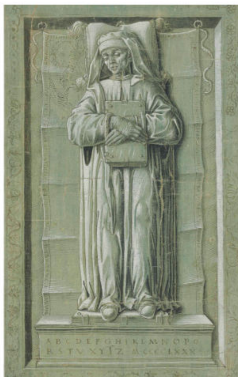
Figura 2 — Estudo para o túmulo de Niccolò Perotti com inscrição apresentando as letras do alfabeto e a data “M·CCCCCLXXX” (c. 1480) 14 .

A morte de Perotti é um tema controverso em sua biografia. Apresenta Mercati, autor da excelente monografia Per la cronologia della vita e degli scritti di Niccolo Perotti, arcivescovo di Siponto (1925), uma versão de sua morte valendo-se de uma nota manuscrita de Pontico Virunio, posterior a 1500: parece que Perotti teria sido envenenado pela esposa de seu sobrinho, Pirro 13 — a quem, aliás, os Rudimenta grammatices foram dedicados —, depois de tomá-la em flagrante tendo relações com seu mordomo. Este testemunho, porém, beira ao duvidoso. Um outro mais crível é a deliberação do conselho municipal de Sassoferrato, datada de 16 de dezembro de 1480, no dia seguinte à morte de Perotti, e redigida por Alberico Pagnani. Lendo-a, sabemos que Perotti não faleceu em Villa Curifugia, senão em sua residência, em Sassoferrato, tendo depois a cidade aberto um crédito para as suas despesas funerárias.