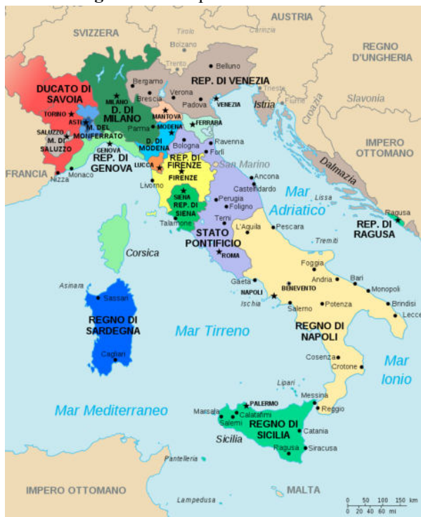
Figura 1 — Mapa da Itália em 1494.