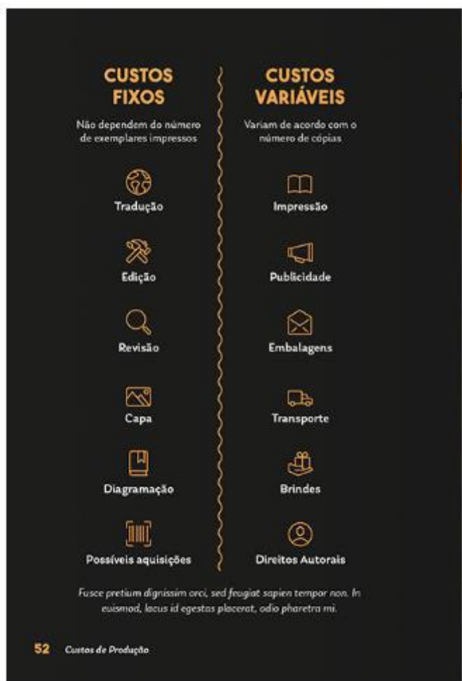
Figura 4 — Livro CROWD! O seu guia de financiamentos coletivos

Fonte: Livro CROWD! O seu guia de financiamentos coletivos.