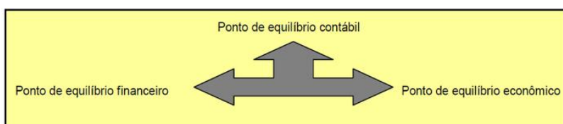
Figura 6 — Tipos de ponto de equilíbrio

De acordo com Wernke (2017, p.50) com base na necessidade da empresa ou do gestor, o ponto de equilíbrio é um meio que possibilita adaptações, se ajustando à diversas situações do planejamento da empresa. Dependendo da necessidade do projeto, o ponto de equilíbrio recebe denominações diferentes, conforme figura abaixo: