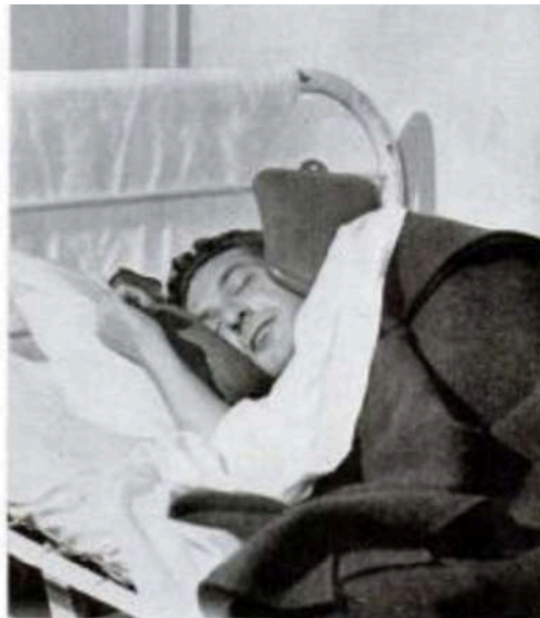
Violent chill is the first stage of malaria attack. The patient above is an inmate of Atlanta penitentiary, where prison malaria experiments were begun and developed.