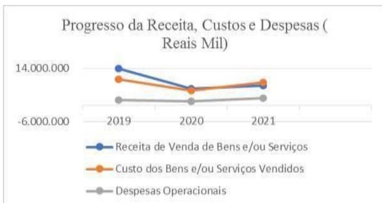
Gráfico 2 - Progresso da Receita, dos Custos e das Despesas Operacionais.

Já na Análise realizada em 2021 com ano base 2020, as Receitas Líquidas aumentaram 17%, da mesma forma, os Custos de Bens e Serviços Vendidos aumentaram 52%. Este aumento das receitas pode ser destacado pela conta Transporte de Passageiros, uma vez que essa variou, positivamente, em 19%. Do mesmo modo, o aumento dos custos pode ser destacado através da conta, Combustível de aviação que cresceu em 2021, 30%. As Despesas Operacionais aumentaram em 2021 em 81% comparando com 2020. O resultado financeiro foi reduzido em 27% em 2021, essa diminuição no resultado financeiro se deve a despesas financeiras, assim sendo, a GOL encerrou o ano de 2021 com uma redução no Prejuízo Líquido em 22%.