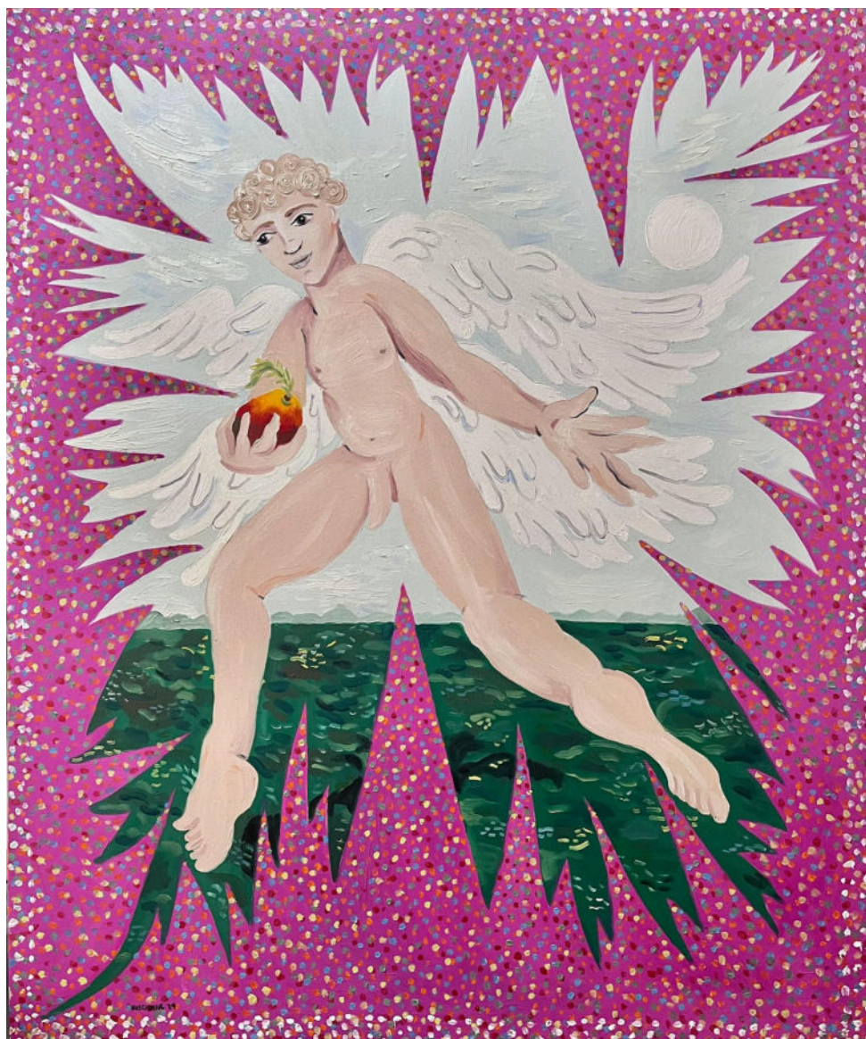
“Anjo de quatro asas”. 2024, óleo sobre tela. 120x100cm

anos, que redescobri com ainda mais força algo que estava presente em mim desde a infância: o amor profundo e incondicional pela Pintura.