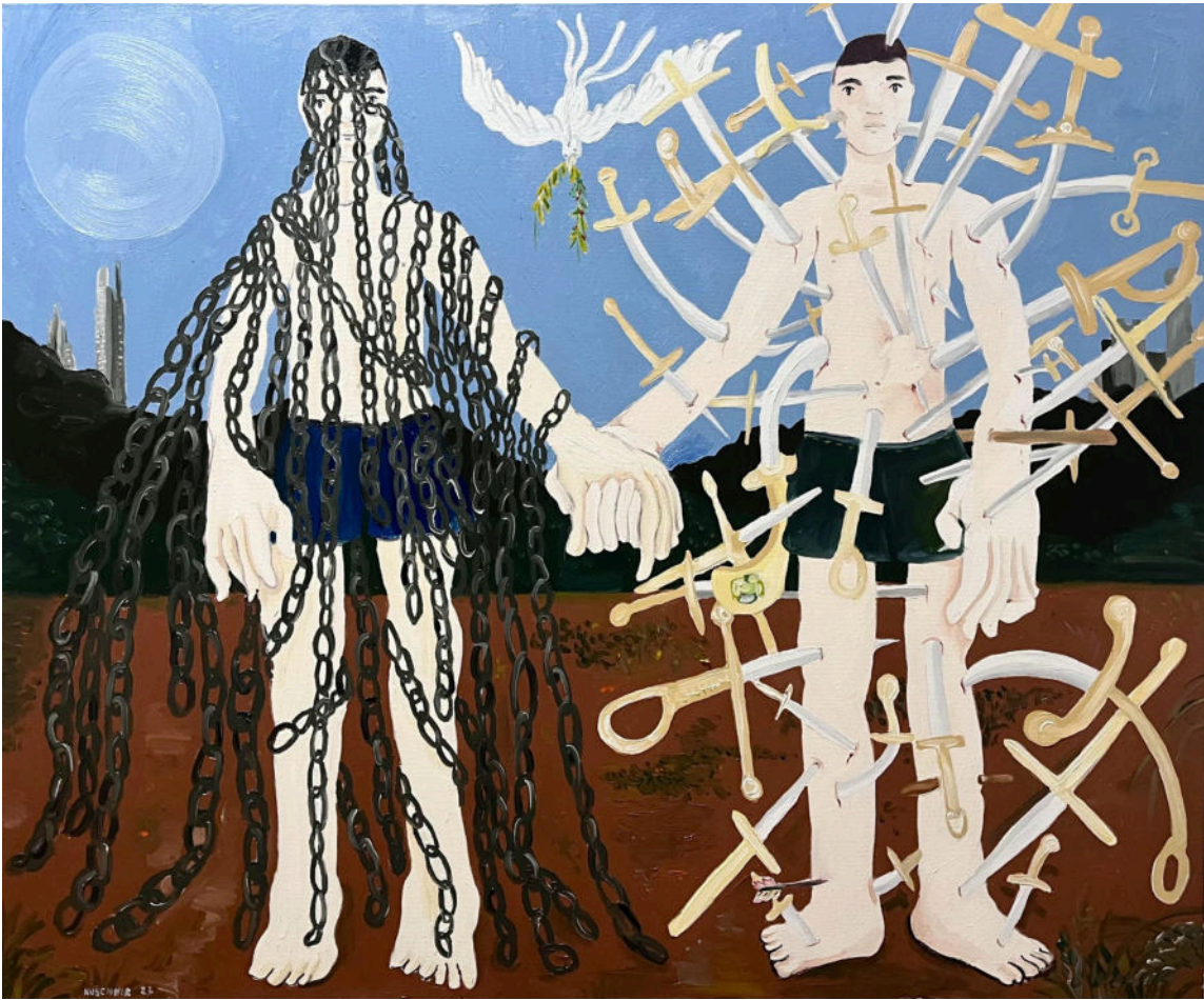
"Eu carrego o seu coração dentro do meu, e você carrega o meu coração dentro do seu", 2023, óleo sobre tela.120x100cm

A dualidade está nessa tela, com a presença lado a lado de duas figuras, uma cravejada de espadas, outra coberta de correntes. No meio, suas mãos estão dadas e uma ave branca sobrevoa a cena. Ao fundo, vemos montanhas e prédios de uma cidade contemporânea. Há algo nessa obra que me encanta, é um dos casos em que o mistério da criação da imagem se faz onipresente. O que pensam essas pessoas?, o que as leva a dar as mãos no meio de uma situação associada à dor, ao sofrimento? São perguntas para as quais não tenho respostas, mas o mistério dessa composição me lembra o poema de E.E. Cummings, um trecho do qual foi traduzido e adaptado por mim para servir de título “[i carry your heart with me(i carry it in)]” (CUMMINGS, 1969, p. 115).