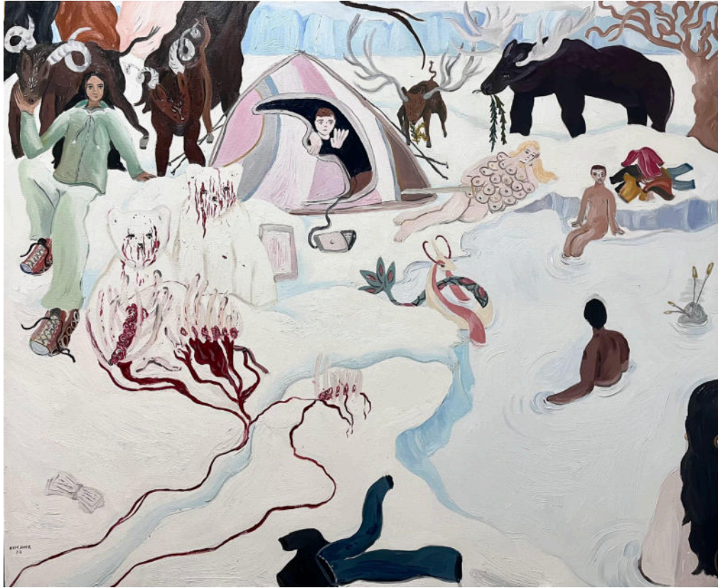
Neve, 150x120cm, óleo sobre tela, 2023