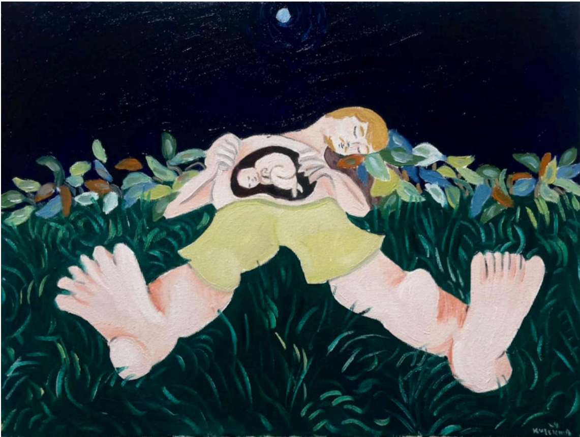
"Gravidez", 2024, óleo sobre tela.30x40cm

Continuando no caminho de trabalhar a pintura enquanto materialização ficcional de mim mesmo, apresento nessa tela um autorretrato deitado na natureza, grávido. O bebê pode ser visto na minha barriga como se num ultrassom. Para além das considerações subjetivas do que é uma gravidez — criação — algo que se reflete no ato de pintura, essa tela é um exemplo concreto da capacidade mágica da imagem pintada fabular realidades novas, que não cabem no plano fotográfico ou racional. Como disse o pintor Philip Guston (2022), “eu pinto o eu que quero ver”.