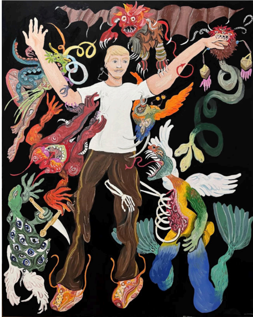
“A Tentação de Santo Antônio”. 2024, óleo sobre tela. 120x150cm

Essa pintura bebe da fonte de uma sequência de obras feitas ao longo da História da Arte que retratam a história bíblica de Santo Antônio e suas tentações. Esse tema, por séculos, foi utilizado como meio de representar os mais diversos e fantasiosos monstros, criaturas e demônios. Seguindo nesse caminho de interligar minha produção a algumas tradições pictóricas, decidi aproveitar a semelhança de nossos nomes e realizar um autorretrato enquanto Santo, rodeado e suspenso por demônios e tentações.