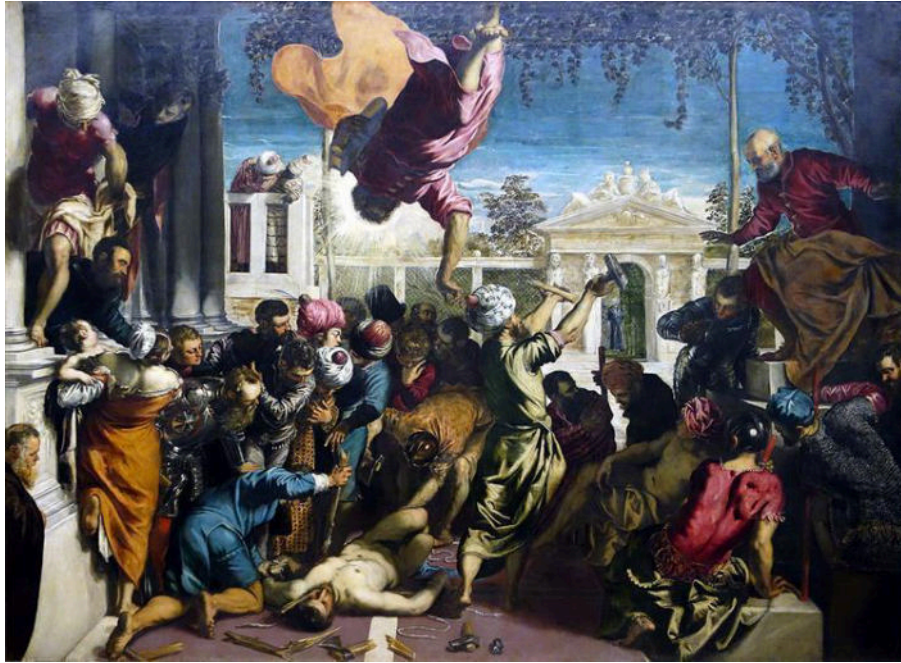
Tintoretto. "The Miracle of St Mark Freeing the Slave". 1548, óleo sobre tela. 415 x 514cm

Como muitos dos pintores passados, utilizo de temas e composições já realizados previamente com maestria por esses artistas, mas, como ninguém entra no mesmo rio duas vezes, nenhum artista interpreta os mesmos temas duas vezes (nem nós mesmos, ao retornar a um assunto previamente representado). Não estou sozinho nesse processo de produzir telas em relação a observações das tradições precedentes. Nos anos 50 e 60 do século XX, Pablo Picasso (1881-1973) pôs-se a "confrontar" pictóricamente vários de seus mestres, como Manet (1832-1883), Velazquez (1599-1660) e El Greco (1541-1614). Picasso utiliza-se das composições, cores e temas dos pintores mencionados, mas vai adaptando, estilizando e canibalizando a produção desses artistas. Sinto que, inspirado nesse processo, realizo o mesmo com meus próprios mestres, com destaque para os já mencionados pintores barrocos e os inovadores modernistas do século passado.