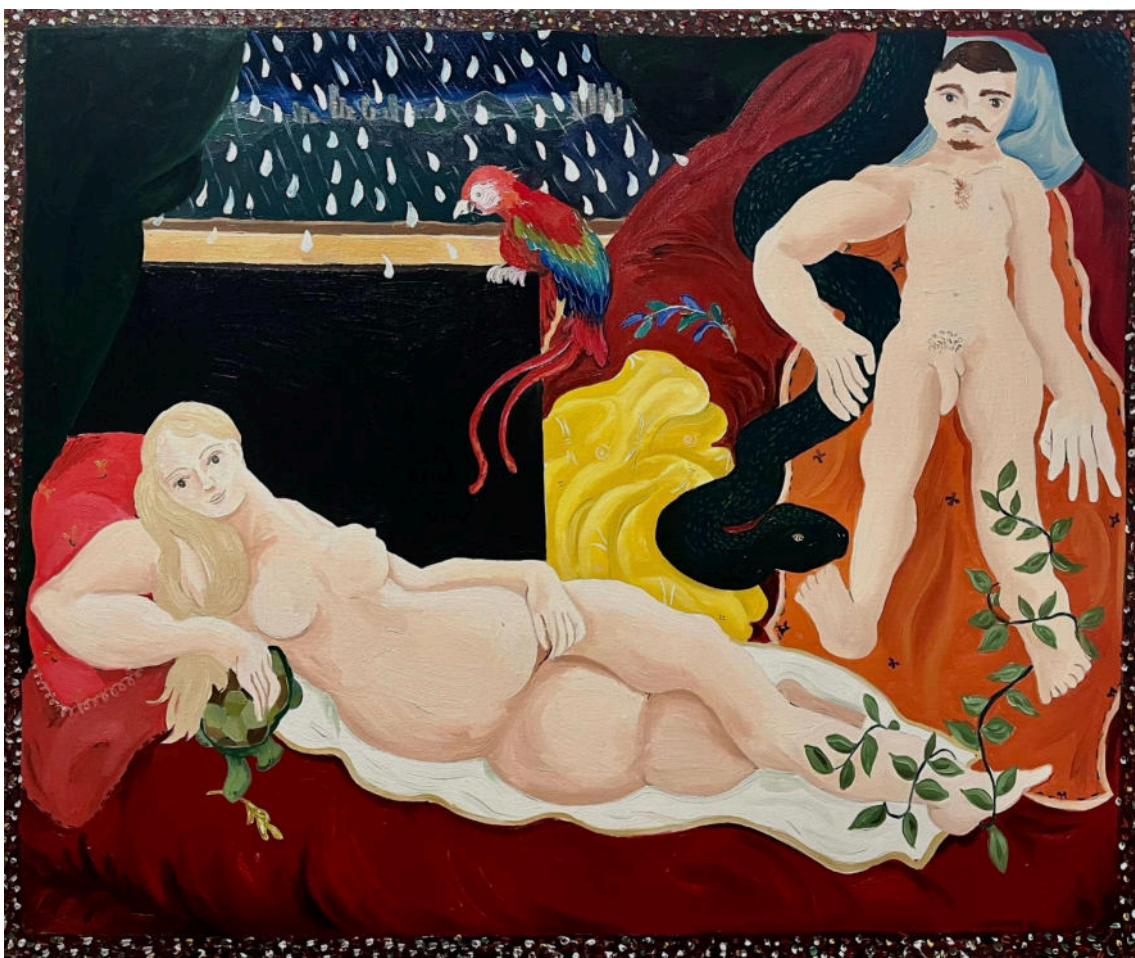
“Eu ando para onde venta, eu corro para onde chove”. 2023, óleo sobre tela. 120x100cm