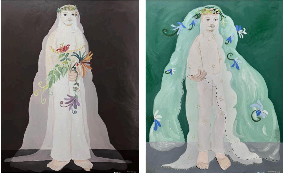
Casamento (I e II), 2024, óleo sobre tela, 120x100cm cada.

O tema da automitologia se faz presente nesses trabalhos, nos quais realizo autorretratos em vestimentas tradicionais de noivas se casando (com exceção da calça). Os tons claros predominam e a atmosfera remete a casamentos em igrejas. Destaca-se, portando, o aspecto de contradição presente na automitologia, em que, se, por um lado, apresento algo íntimo como um autorretrato — numa situação que condiz com minha vida pessoal — intercalo isso com símbolos estabelecidos em séculos de tradição ocidental: o casamento, o véu, o buquê de flores.