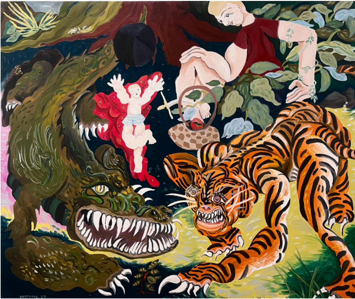
“À plena voz”. 2024, óleo sobre tela. 120x100cm

Essa pintura, cujo título faz referência a um dos últimos poemas do poeta soviético Maiakovski, trabalha com o contraste entre a figura do bebê brincando ao fundo com os dois animais imensos no primeiro plano, se confrontando. Se, por um lado, vemos uma cena de conflito intensa, aumentada pelos dentes e garras exageradas do tigre e do jacaré, vemos um bebê de braços abertos, se divertindo, ignorante à batalha que se ensaia em sua frente. Uma reflexão, também, acerca da impossibilidade inerente ao plano bidimensional estático da tela e as inferências simbólicas sobre ele projetadas pelo espectador.