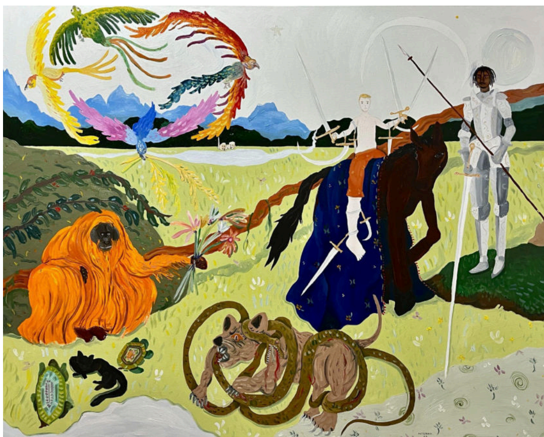
“Dia”. 2022, óleo sobre tela. 120x150cm

A proposta deste trabalho é apresentar algumas das pinturas destacadas que produzi ao longo da graduação em Pintura pela EBA - UFRJ. As obras que compreendem esse conjunto variam em tamanho, tema e assunto. Produzidas em óleo sobre tela, buscam explorar a linha tênue e sutil entre magia e realidade, imaginário e verdadeiro.