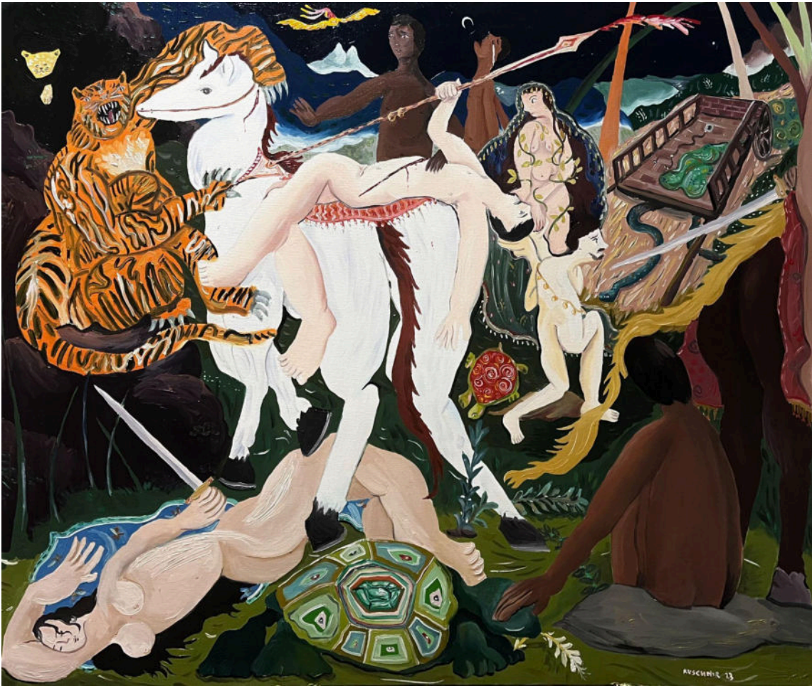
“Eu vou te amar para sempre”. 2023, óleo sobre tela. 120x100cm