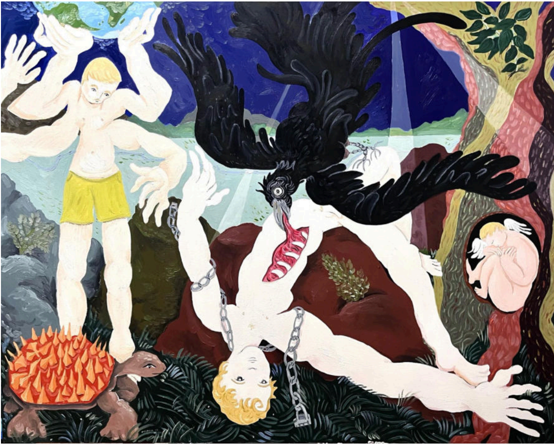
“Canto de Mim Mesmo”. 2024, óleo sobre tela. 120x150cm

Em “Canto de Mim Mesmo”, cujo título faz referência ao épico de de Walt Whitman, realizo três autorretratos utilizando figuras mitológicas clássicas. Da direita pra esquerda, temos um anjo, de aparência infantil e portando duas asas, que dorme dentro de uma árvore. No centro, vemos um autorretrato enquanto Prometeu, figura da mitologia grega que passa a eternidade tendo parte do seu corpo devorado por uma ave após desagradar Zeus. No lado esquerdo, representei um Atlas de quatro braços, carregando o planeta Terra.