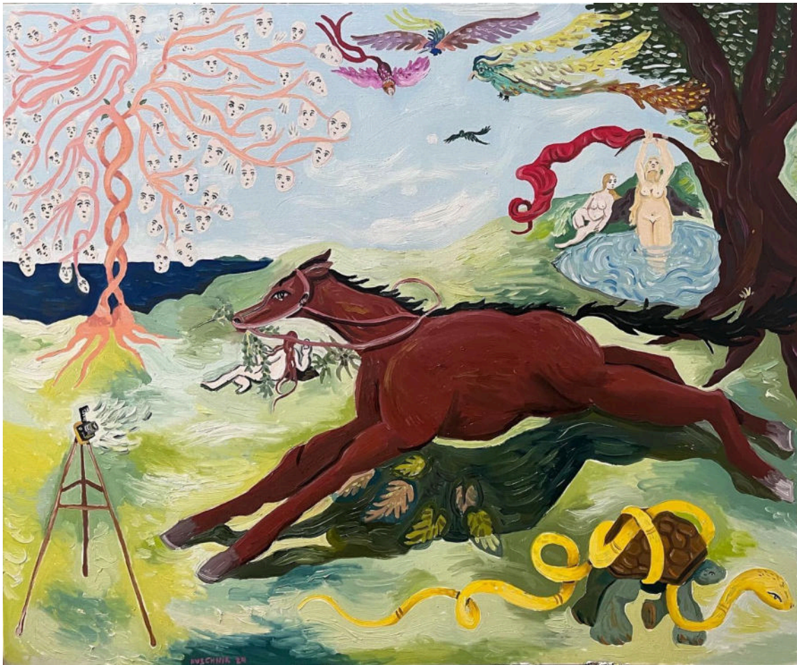
“Fotografia de cavalo (Pintura para Géricault e David Hockney)”. 2024, óleo sobre tela. 120x100cm

Durante séculos, antes da invenção da fotografia química no séc. 19, os cavalos foram retratados correndo e galopando da forma como mostra essa tela - as quatro pernas abertas (para frente e para trás), e ele todo suspenso no ar. Com a descoberta da fotografia e o início de experimentos que permitiam ver exatamente a movimentação de um cavalo, ficou provado, entretanto, que a pose vista e retratada por incontáveis artistas ao longo de milênios simplesmente não acontecia na natureza, na dita "vida real". Nesse momento, chocavam-se duas realidades. A da tradição europeia da pintura pós-renascimento, que buscava retratar com fidelidade o "real" observado pela subjetividade a olho nu do espectador - o cavalo suspenso de pernas abertas - e a fotografia matemática mais-que-real que dizia provar: o cavalo jamais poderia estar suspenso na pose em que, por séculos, ele fora retratado.