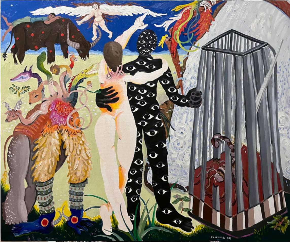
“Amanhã, na batalha, pensa em mim.”. 2024, óleo sobre tela. 120x100cm

Mil olhos, um escorpião enjaulado, uma quimera de várias cabeças, um anjo, uma cachoeira e uma figura de costas que aponta para o céu.