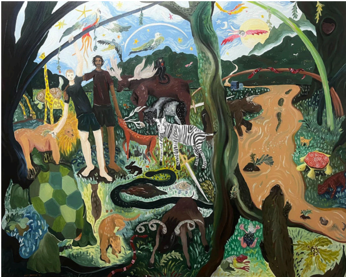
“Jardim”. 2023, óleo sobre tela. 120x150cm