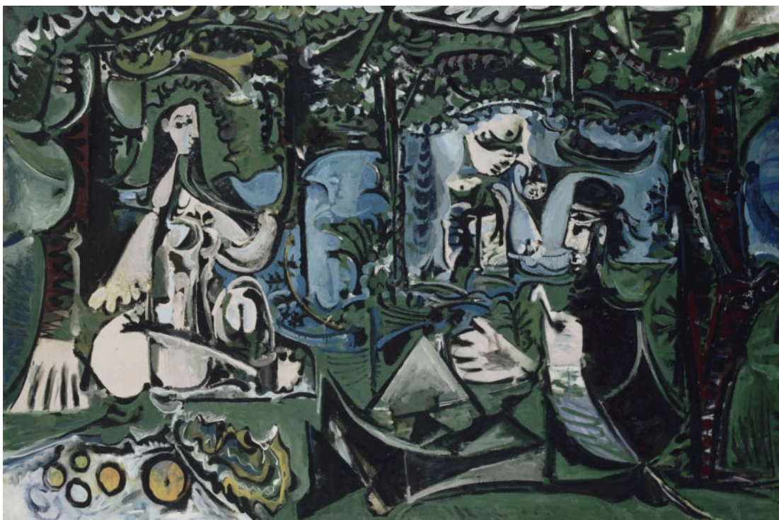
Picasso. “Le déjeuner sur l'herbe d'après Manet, 3 mars-20 août 1960”. 1960, óleo sobre tela.

Há muito tempo possuo uma admiração profunda pelo trabalho de Henri Matisse (1869-1954), que me inspira não somente como pintor e artista plástico, mas como ser humano. Sua vida de dedicação exclusiva à arte e ao fazer pictórico é admirável, e seus escritos sobre pintura oferecem uma preciosa visão de primeira mão sobre a riqueza e multiplicidade do ato de produzir uma tela. Ao me deparar com seus relatos, entrevistas, indagações, percebo um homem profundamente preocupado com a pintura-em-si, a concretude do plano imagético formal, muito além das análises psicológicas, sociais e biográficas. Não desmereço essas abordagens, posto que elas integram minhas reflexões sobre meu próprio trabalho. Mas é de tremenda inspiração ter como referência máxima uma perspectiva acerca da arte que se preocupa com os elementos mais fundamentais e indissociáveis da pintura — linha, cor, forma, desenho, sombra, luz, fatura etc. Em última instância, é pelas relações formais e cromáticas que o cerne do meu trabalho, o processo de produção da imagem em si, se guia.