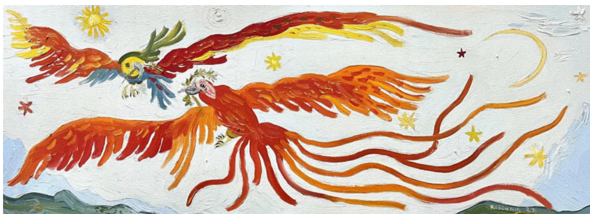
“Pássaros Vermelhos”. 2022, óleo sobre tela. 24x60cm

Me emociono ao pensar que, há mais de vinte mil anos atrás, pessoas como nós, em alguma caverna, deserto ou montanha pelo mundo decidiu criar uma imagem, gravar uma marca de sua existência — e assim criar algo novo . O ato é, essencialmente, o mesmo que realizamos em 2024. Aplicar uma substância líquida colorida — a tinta — contra uma superfície — paredes, telas, rochas — utilizando alguma ferramenta com pelos — hoje, os pincéis sintéticos, ontem pelos de animais ou cabelo humano. E, ao final desse ritual (por que não?), concebe-se uma criação. Algo surge, inatamente humano, de novo no mundo.