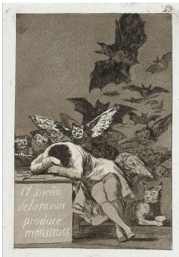
Francisco Goya. The sleep of reason produces monsters, 1799. Gravura a água forte. 30.48 × 20.32 cm.

Ambos, nas séries mencionadas, tratam dos mais diversos temas. São parte da tradição dos capriccios . Como polos opostos, entretanto, percebemos uma volta de Goya para o social, externo, enquanto Picasso se concentra nos temas internos, de amor e criação. Ter como base ambas as obras e o conjunto do qual cada uma faz parte nos oferece mais um exemplo na história da arte do uso de longas séries para tratar de uma imensa diversidade temática. Assim, artistas ao longo dos séculos vêm utilizando-se do recurso de séries-comentário sobre os temas mais amplos, como a vida, a morte, o social, a criação artística etc.