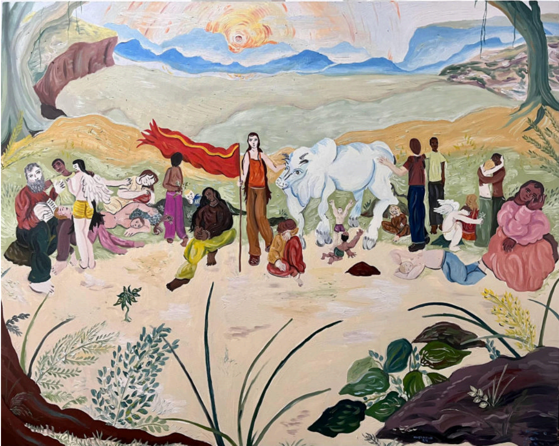
"Dormir como dorme a terra, acordar como nasce o sol, viver como serpenteia a água pelas rochas de uma cachoeira em um rio cheio na floresta." 2024, óleo sobre tela. 120x150cm

A pintura retrata um grupo de pessoas que estão colocadas na região central da tela, acompanhadas de um pôr do sol impressionista e um boi branco. A bandeira vermelha da coletividade carregada pela mulher no meio da composição se destaca, vibrante, em contraste com as cores terrosas menos saturadas da natureza ao seu redor. O título comenta sobre o espírito dessa pintura, como se os personagens aqui presentes estivessem em comunhão com a natureza, vivendo como ela vive. A horizontalidade desses ideais se expressa na composição do próprio desenho.