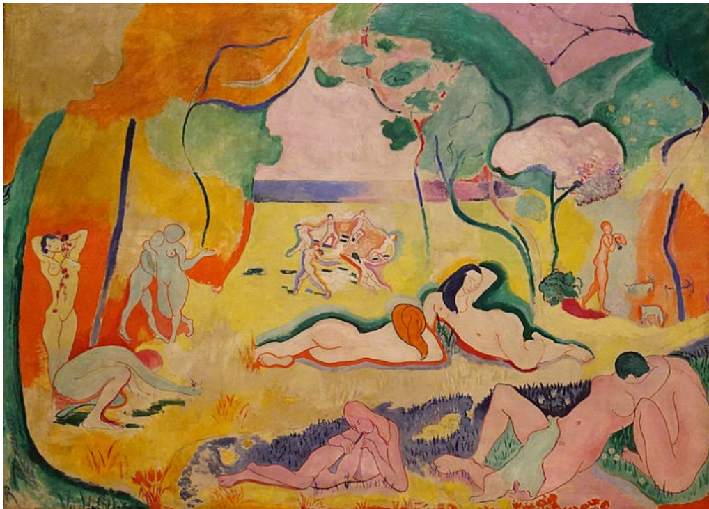
Matisse. "Le Bonheur de vivre". 10905-06, óleo sobre tela, 176x240cm.