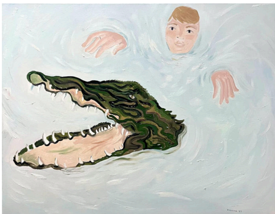
"eu nadando com jacaré", 2023, óleo sobre tela. 70x90cm

Entender meu trabalho como um microcosmos automitológico é consequência lógica de um modo de trabalho, de uma forma de enxergar a pintura, que me leva à indissociabilidade da produção visual e do meu cotidiano. A mitologia se torna pessoal, e o pessoal se torna mitológico.