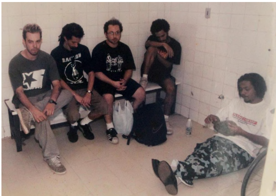
“Os integrantes da banda em cana: livres do flagrante”, 09/11/1997 (Autor: Raimundo Paccó)

Disponível em: https://piaui.folha.uol.com.br/planet-hemp-show-belem-prisao/