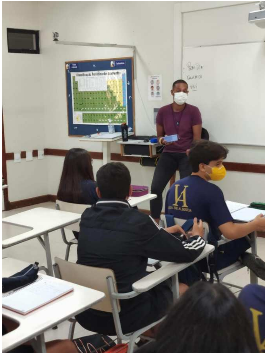
Figura 3 – Aula de modelos atômicos (estágio)