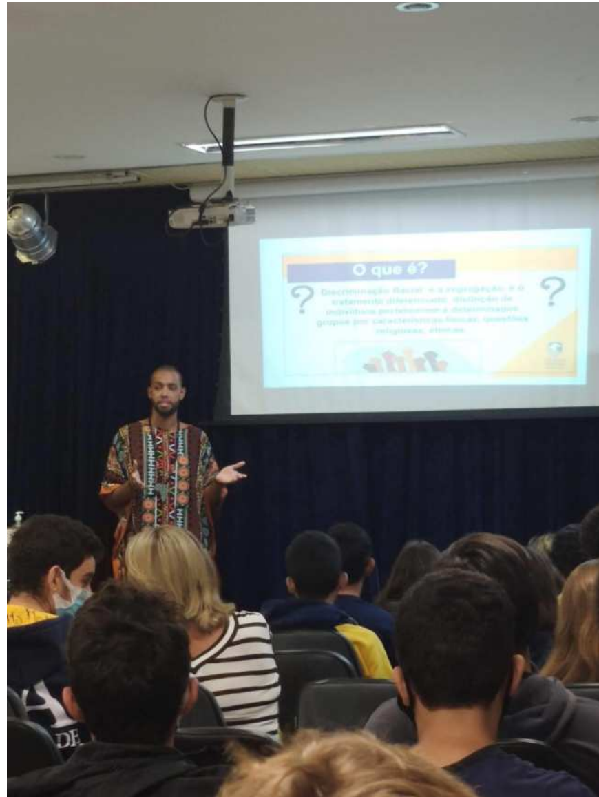
Figura 4 – Palestra sobre o dia internacional contra a discriminação racial