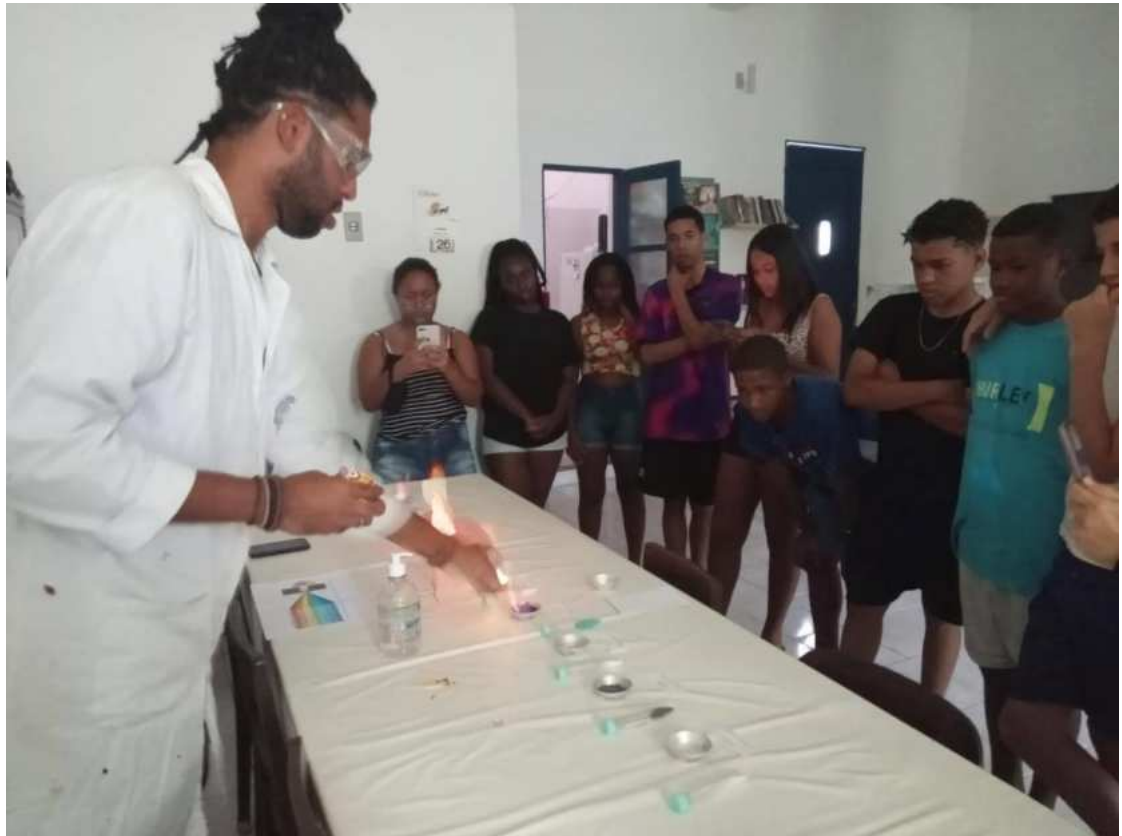
Figura 5 – Aula sobre ciência e ensino de química