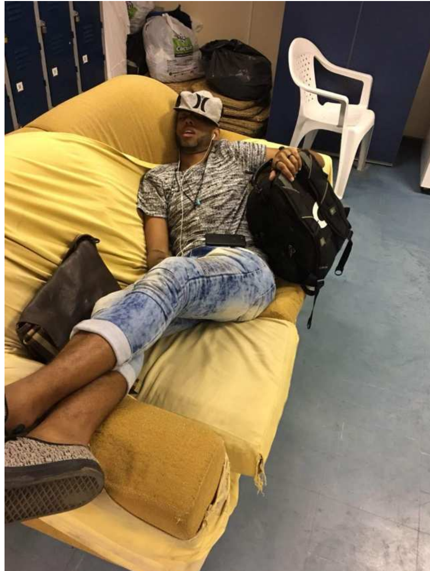
Figura 8 – Dormindo antes da primeira aula