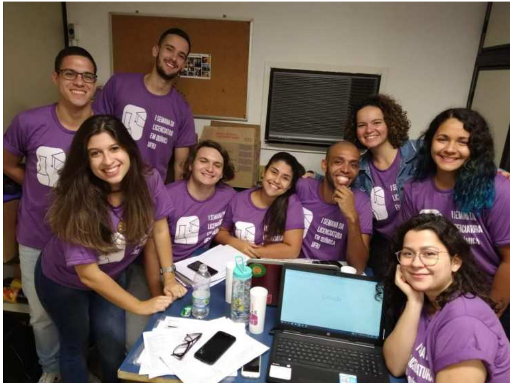
Figura 1 – Comissão organizadora da primeira edição da SELIQ/UFRJ