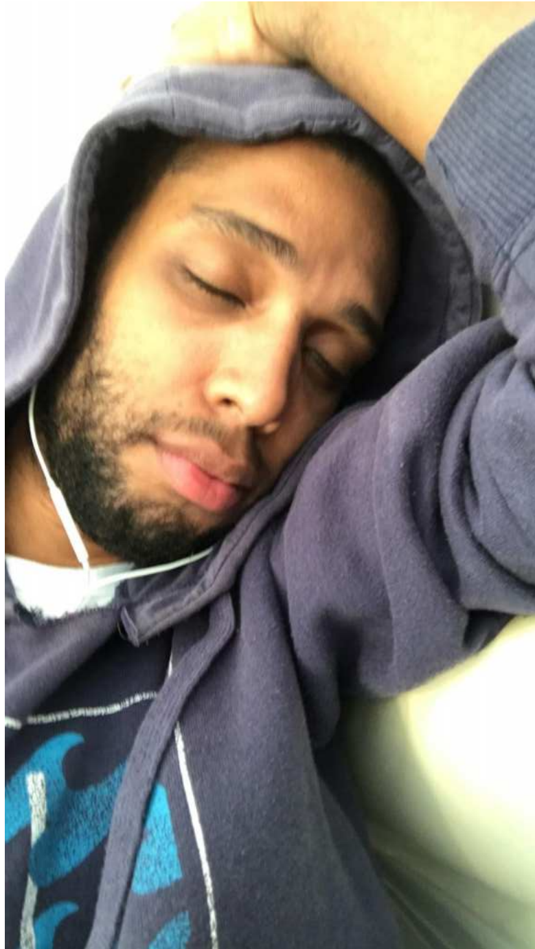
Figura 9 – Dormindo durante a aula