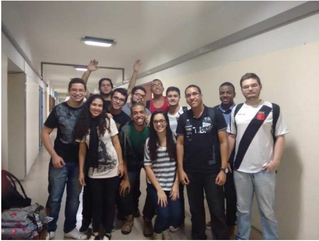
Figura 6 – Turma (incompleta) de calouros de Licenciatura em Química