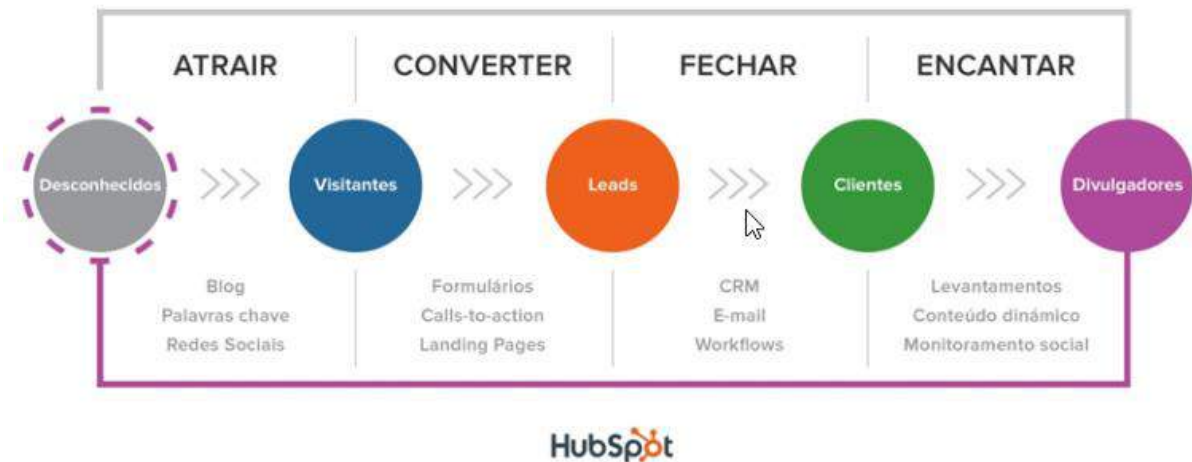
Figura 5: Etapas do inbound marketing

buscam acompanhar toda a relação entre entrar no radar dos consumidores interessados até sua retenção e retorno para uma nova compra.