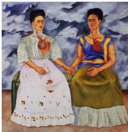
Pintura 2: Las dos Fridas (KAHLO, 1939)