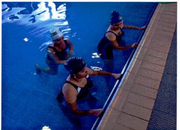
Figura 2 – Exercícios aquáticos específicos para gestantes