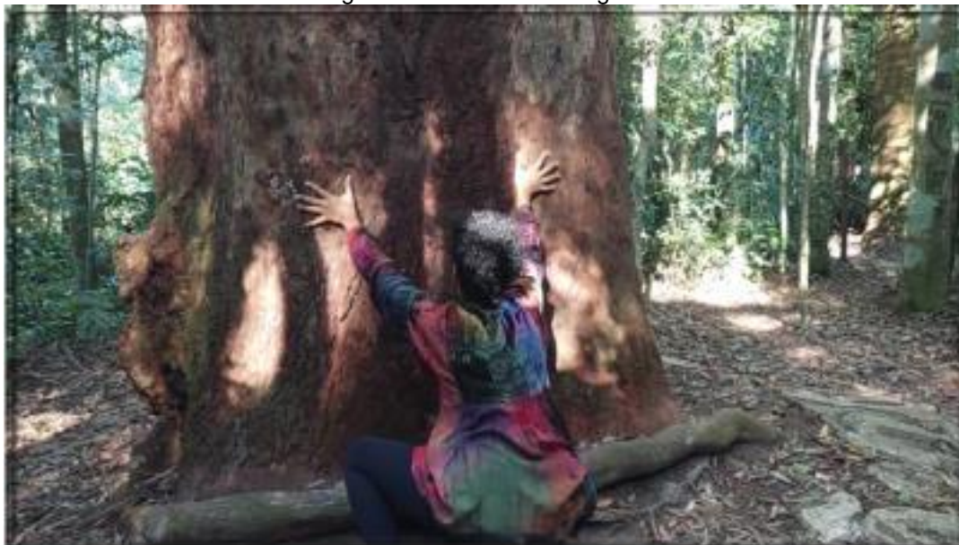
Figura 4: Cena de Des-engolir.