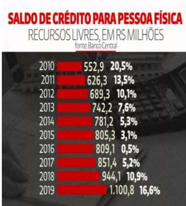
Fonte: Banco Central do Brasil 2020