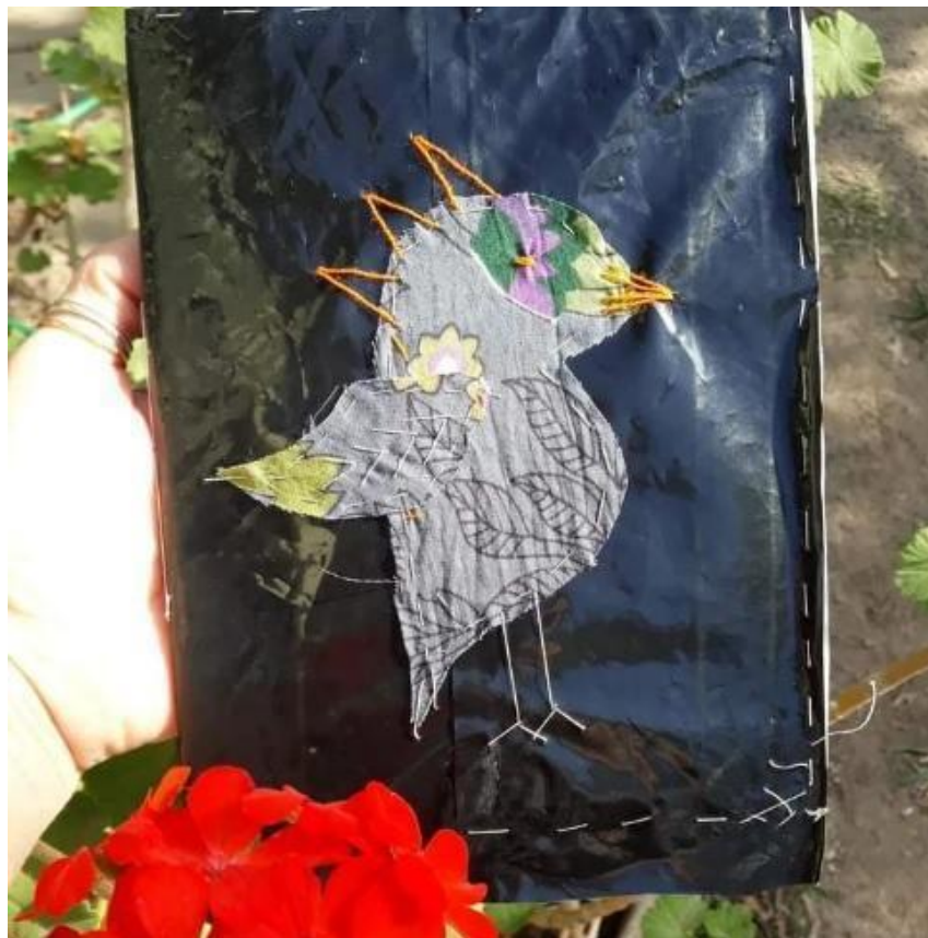
Alejandra Bosch em instagram.com/ediciones.arroyo_editorial .