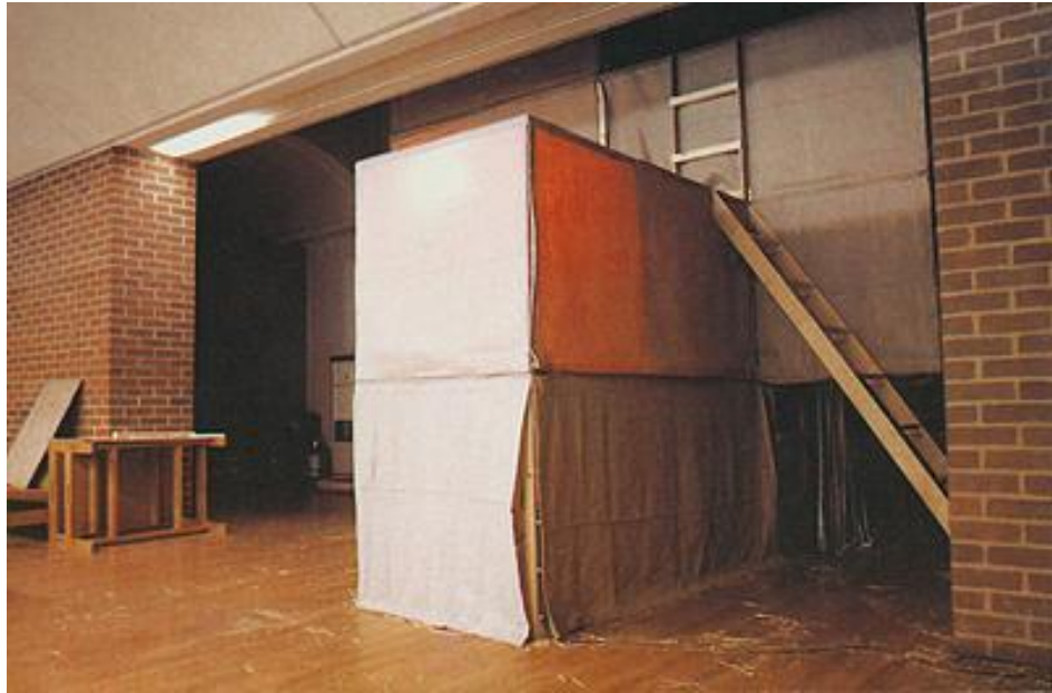
Oiticica, Hélio. Ninhos, 1969.

Alejandra Bosch, por sua vez, produz, nessa leitura, um paralelo ou até uma interseção entre a casa e o ninho que está no telhado da casa da sujeita poética e que ela trata como essa estrutura em processo de construção. Além disso, ao negar a morte no primeiro verso, a sujeita poética afirma a vida como algo que se passa dentro de uma casa, numa relação de dependência entre esse espaço e a continuidade da vida.