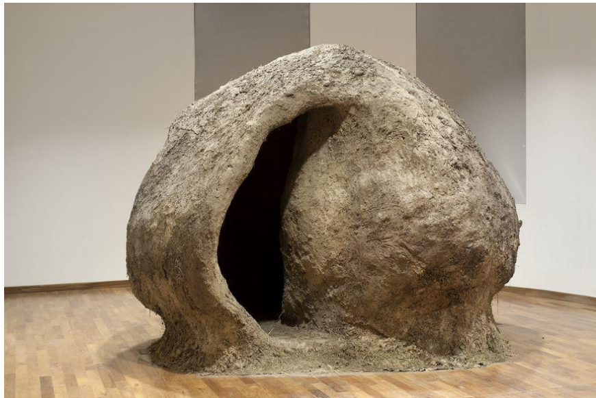
Minujín, Marta. Comunicando con tierra , 1976.

A ideia do ninho está nas obras de muitos artistas latino-americanos, como por exemplo na da artista argentina Marta Minujín, Comunicando con tierra (1976), recriada recentemente. Ela consiste em um enorme ninho, como o do João-de-Barro, feito de uma mescla de terra peruana e argentina, onde as pessoas poderiam entrar. Uma série de significados são evocados com a obra, dentre eles a fusão entre corpo e natureza.