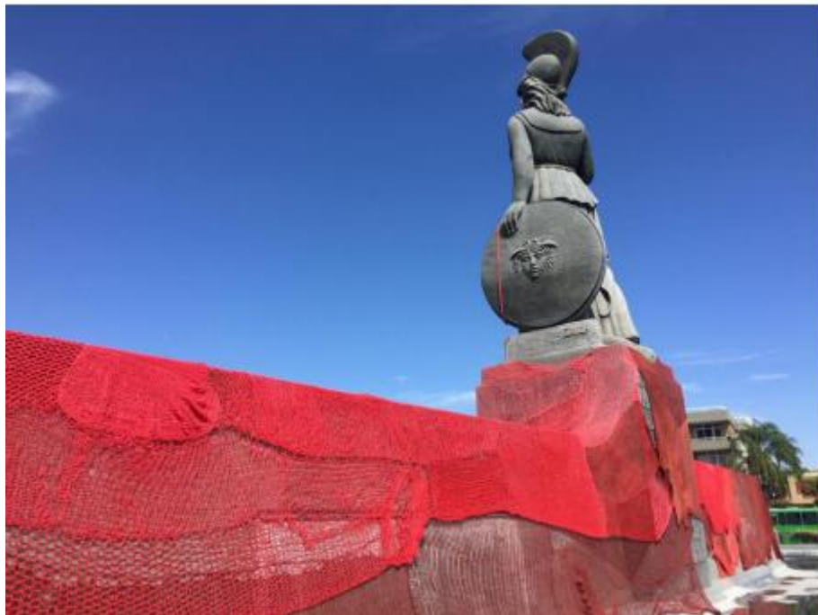
Coletiva Hilos. “Sangre de mi sangre”, 2022.

Além do trabalho com as mãos, que remete à familiaridade e vantagem das mulheres para operar sobre o tecido do texto pelo avesso, apontada por Kamenszain, também há o trabalho coletivo, baseado nas relações afetivas e na construção dos comuns. Como observa Federici, nos anos 90 há um retorno desse princípio nos discursos como uma reação e uma alternativa à instauração e propagação da lógica capitalista da propriedade privada. Essa recuperação dos comuns encontra seus principais exemplos nas Américas Latina e Hispânica, e mobilizado por mulheres (Federici, 2020, p. 352). É o caso da Coletiva Hilos, por exemplo, grupo mexicano de mulheres artistas que se utilizam de técnicas têxteis para promover intervenções performáticas em um “protesto contra as gravíssimas violações dos Direitos Humanos que ocorrem no país, bem como um ritual de memória e cura pública e coletiva.” (Hilos apud . Boechat, 2022, p. 191).