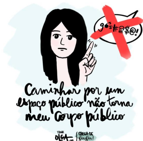
Figura 7 - Chega de fu-fiu I

Portanto, pode-se dizer que as duas figuras dialogam com a memória social do machismo e pretendem romper com a cultura dominante em busca de autonomia nas suas escolhas. Na figura 5, pode ser ressaltada também a objetividade do discurso como visto em Bakhtin, uma vez que promove o dialogismo entre o enunciado e o interlocutor. Outro assunto que também iremos ver nas próximas imagens.