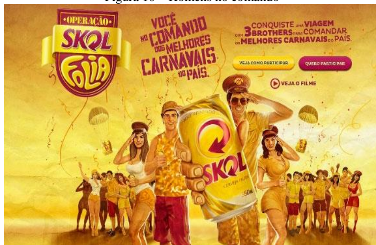
Figura 10 – Homens no comando

Na imagem acima podemos perceber o habitus na objetificação do corpo feminino. Nela podemos observar que a função tanto do bebedouro quanto da mulher é, basicamente, satisfazer aos desejos sexuais masculinos. Ele se evidencia no padrão estético da modelo, no ato realizado por ela, na sua vestimenta e no enunciado textual da imagem.