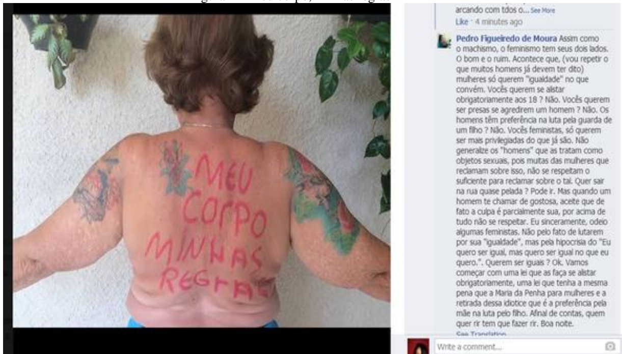
Figura 2 – Meu corpo, minhas regras

Quando a mulher se revolta contra sua posição de subordinada, afirmando que "O corpo é MEU!" de forma taxativa, com o uso de letras em caixa alta, exclamações, sublinhados etc, ela se vale de signos linguísticos para assumir uma posição de confronto, emergindo nesse confronto a luta de classes. Conforme afirma Bakhtin, "O signo se torna a arena onde se desenvolve a luta de classes". (2009, p. 47)