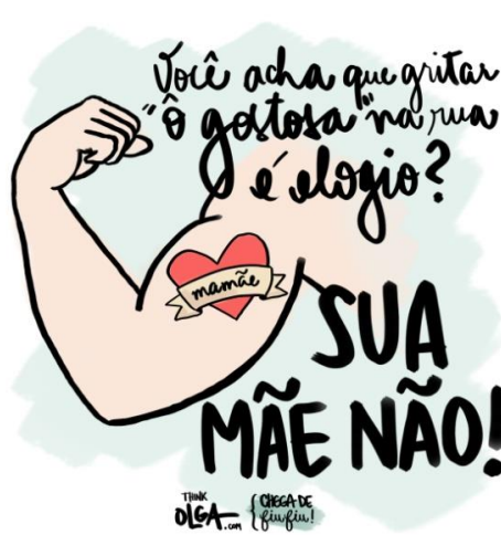
Figura 8 - Chega de fu-fiu I