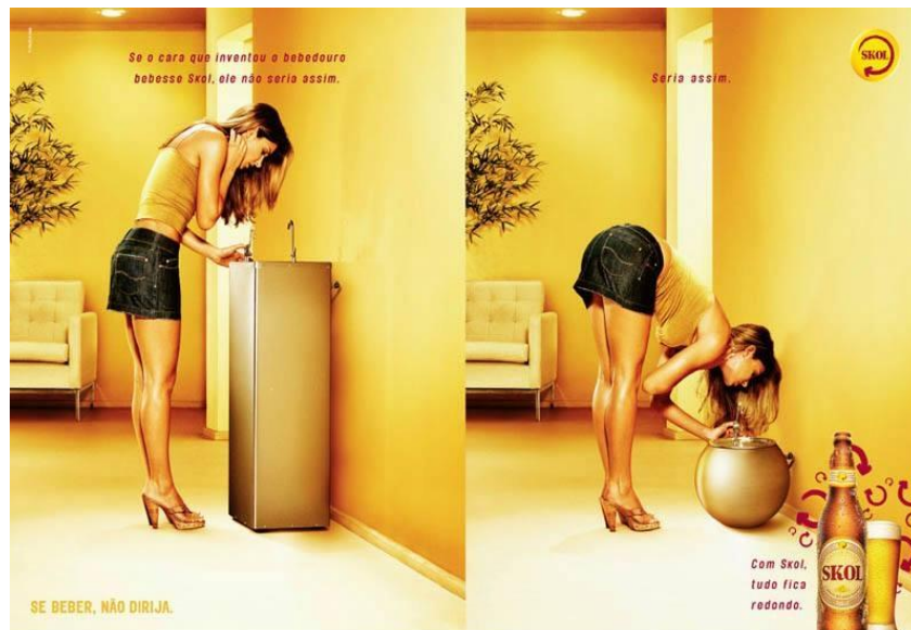
Figura 9 – Bebedouro de Skol