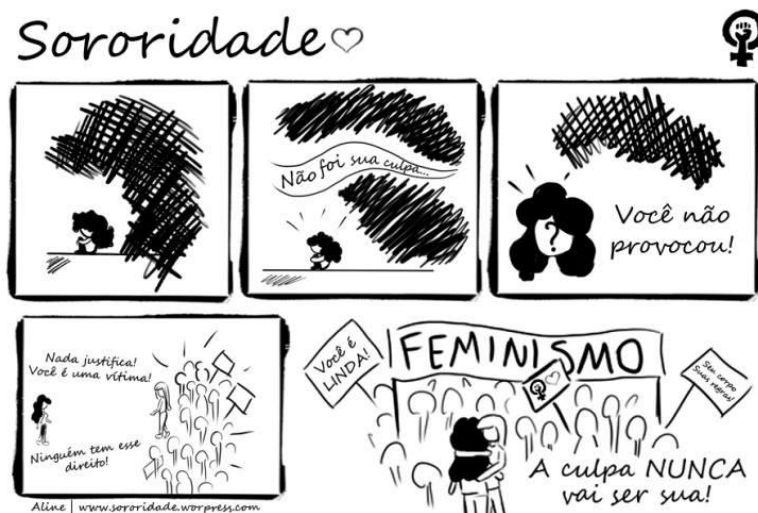
Figura 3 – Feminismo e Sororidade