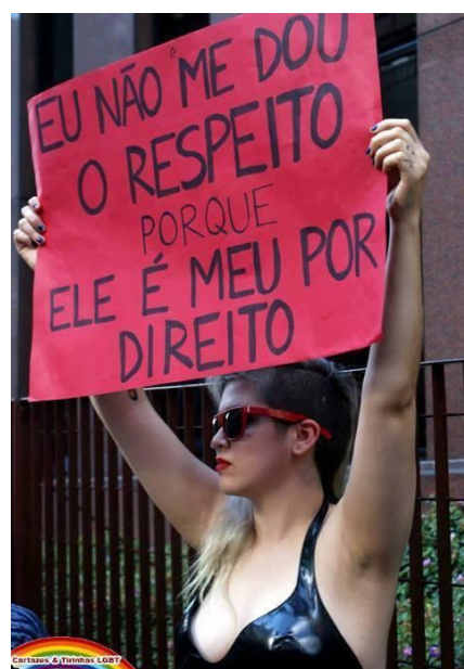
Figura 6- Meu respeito, meu direito