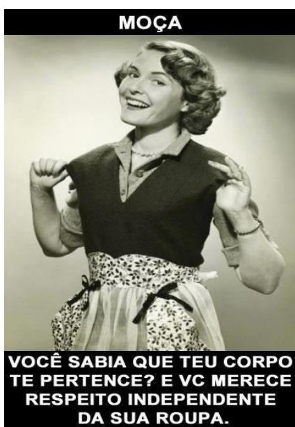
Figura 5 – Seu corpo te pertence