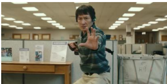
figura 6: Agente secreto Waymond.