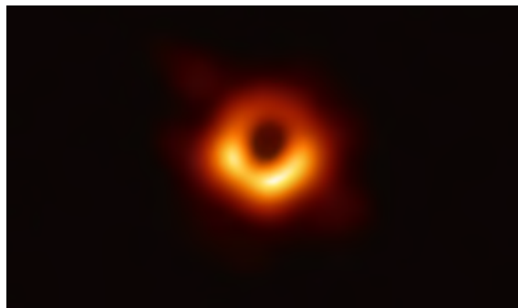
figura 13: Imagem de um buraco negro na via láctea captado pela Nasa . Disponível em: https://www.nasa.gov/universe/what-are-black-holes/

Esse vazio na forma de um buraco negro nos traz a ideia de uma não existência absoluta, onde tudo se iguala na não importância. A própria Joy explica que tudo está lá (de memórias de infância às contas para pagar), tudo é engolido pela falta de sentido, pelo vazio. Todas as referências se perderam e se vão, todas as experiências nas outras vidas mostraram para Joy que tudo depende de um contexto social e temporal para que tenham valor/sentido ou não.