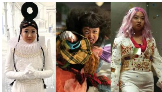
figura 5: versões de Jobu Tupaki.

Joy é a filha adolescente de Evelyn. Ela não se encaixa na vida que tem ao lado dos pais e do avô. Há um conflito causado também pelo fato de os pais serem imigrantes chineses e ela ter nascido e crescido nos Estados Unidos. O seu desconforto e frustração são visíveis. Não consegue conversar com a mãe que acha que ela é apenas uma filha rebelde e imatura. Mas descobrimos ao longo do filme que na verdade ela é Jobu Tupaki, um ser cuja mente foi sobrecarregada com as experiências no multiverso e que Joy é apenas uma de suas versões. Ela tenta mostrar à Evelyn o que ela considera “a verdade” da vida: nada importa. Joy é responsável por mostrar uma das opções de como lidar com a vida comum: se deixar ser engolida pelo vazio e escuridão de um buraco negro em forma de bagel.