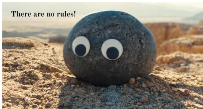
figura 11: Universo das pedras (Tudo..., 2022, 01:54:44)

E então, em uma conversa aberta e sincera, Evelyn pergunta a Joy qual é a verdade. Joy simplesmente responde: “Nada importa” (Tudo..., 2022, 01:01:01). E não apenas isso, mas também declara que “Não há regras!” (2022, 01:54:44) em um momento do filme onde elas existem sob a forma de pedras no meio do deserto decoradas com olhos de plástico. Uma forma de mostrar que realmente não há regras para a existência, as possibilidades são infinitas.