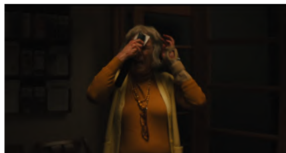
Figura 10: Grampear a própria testa (Tudo..., 2022, 38:04)

Assim, o absurdo não é apenas reconhecido, é aceito e é incorporado para exercer todas as possibilidades da vida. É a forma como Evelyn vivencia o estranhamento, o desenvolvimento da consciência, é de fora pra dentro, sendo obrigada a ver que há muito mais além da vida ordinária à qual está acostumada. E que mesmo os gestos mais absurdos podem ser necessários para alcançar o objetivo desejado. É quando o indivíduo de Camus ousa se entregar aos questionamentos, aos “por quês”.