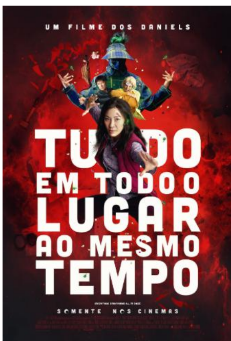
figura 2: Pôster do filme.

O filme Tudo em Todo Lugar ao Mesmo Tempo ( Everything Everywhere All at Once ), 2022, foi dirigido por Daniel Kwan e Daniel Scheinert, com Michelle Yeoh (Evelyn), Stephanie Hsu (Joy), e Ke Huy Quan (Waymond). É um filme intenso onde Evelyn, Joy e Waymond viajam em universos diferentes se questionando sobre suas escolhas de vida. Ao longo dessa jornada, deparam-se reflexões sobre o sentido da vida, relações familiares e modos diferentes de lidar com as frustrações que surgem.