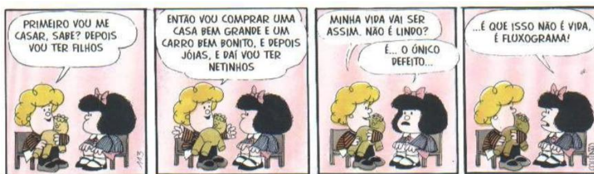
figura 8: Mafalda e Susanita (Quino , 2003).

Segundo Aristóteles, o homem é um ser social e aquele que vive sem cidade ou é um ser degradado (um animal) ou está acima da humanidade (um deus). Logo, vivemos inseridos em uma sociedade, e esta sociedade possui uma estrutura na qual se sustenta e se mantém em funcionamento. É comum que a existência se torne um fluxograma ao qual nós somos apresentados desde a infância, como Quino nos apresenta de modo criativo em um dos seus quadrinhos da personagem Mafalda: