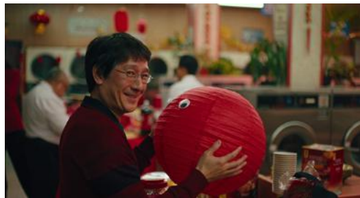
figura 7: Waymond marido de Evelyn.

Waymond é o marido de Evelyn. Evelyn é mais preocupada com todos os detalhes burocráticos da vida, em não desagradar o pai conservador, administrar a lavanderia da família e demonstra estar constantemente consumida por essa preocupação e pela culpa. Em contraste, Waymond surge como alguém amigável, pacífico, comunicativo e otimista. Porém, esse Waymond amigável apresentado como o marido da personagem principal, na verdade é mais uma das versões de um Waymond que viaja pelo multiverso em busca de alguém que possa enfrentar Jobu Tupaki. Por ser um funcionário do Alfaverso, ele precisa cumprir sua missão.