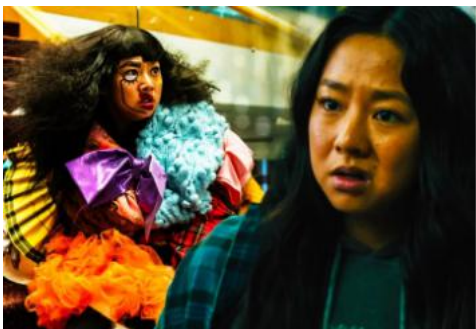
figura 4:Jobu Tupaki / Joy.