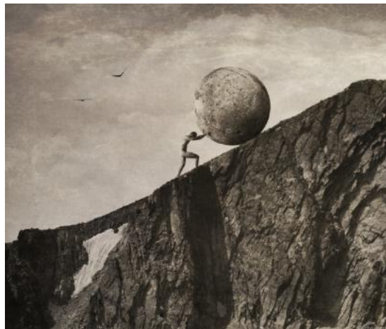
figura 1: Sísifo, ilustração de Jeffrey Hummel

A atividade é repetitiva e cansativa até o ponto que se torna automática. Porém, quando a pedra rola morro abaixo, a pedra não pesa mais, ele não está mais ocupado em não deixá-la cair. É o tempo que Sísifo tem para pensar, não necessariamente em uma fuga, mas para se perguntar por que está ali, realizando exatamente o mesmo trabalho todos os dias, do mesmo modo, no mesmo lugar. Camus diz: “É durante esse regresso, essa pausa, que Sísifo me interessa.” (Camus 2017, p.194). É nesse momento que a consciência pode acontecer e cada dia se torna uma escolha consciente do absurdo, não mais automático, principalmente no momento do retorno. O retorno não precisa ser cegamente guiado pela tarefa. “É preciso imaginar Sísifo feliz.”(Camus, 2017, p. 198)