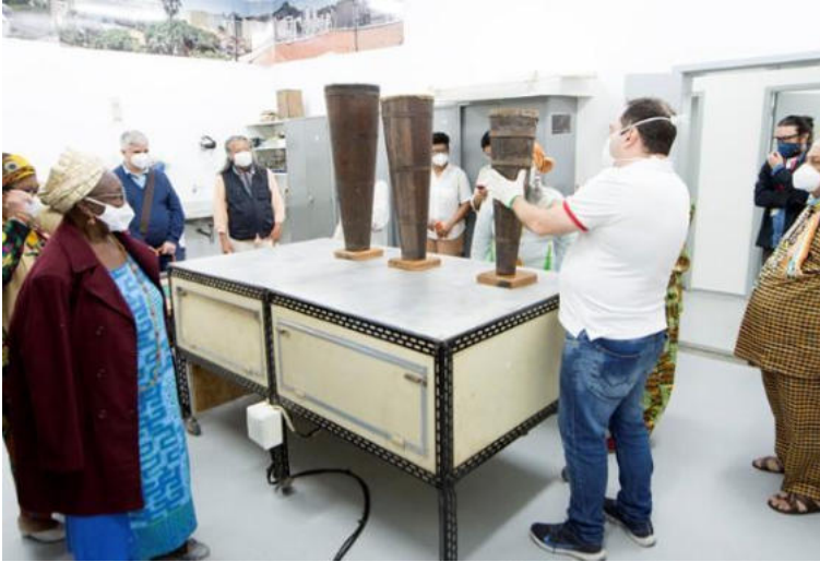
FIGURA 12 - Imagem de alguns integrantes do GT e servidores do Museu da República observando as estruturas produzidas para suporte dos atabaques.