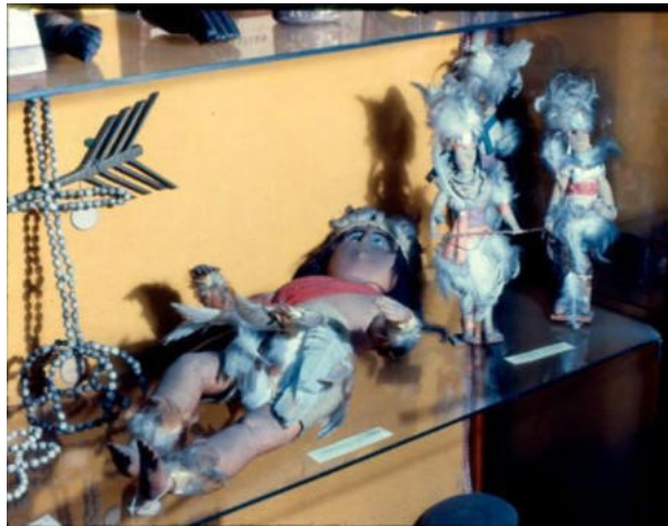
Fotografia 2: Exposição de objetos da coleção no Museu da Polícia.