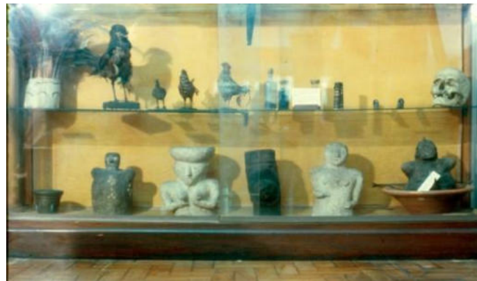
Fotografia 4: Exposição de objetos da coleção no Museu da Polícia.