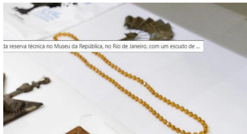
Fotografia 16 - Fio de contas de Oxum e Abebé de Oxum doados por Mãe Meninazinha.