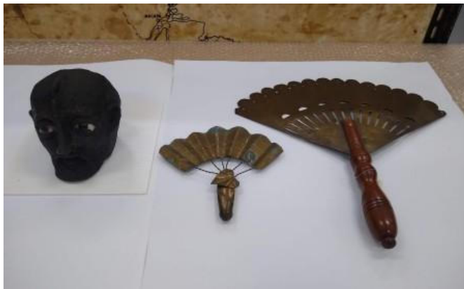
Fotografia 15 - Escultura de Exú Ijelú, Abebé de Oxum doado por Mãe Meninazinha e Abebé de Oxum oriundo da coleção Nosso Sagrado. Peças em preparação para irem para a exposição.