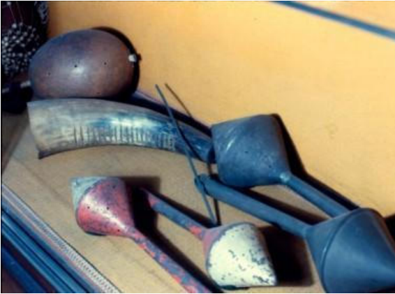
Fotografia 5: Exposição de objetos da coleção no Museu da Polícia.