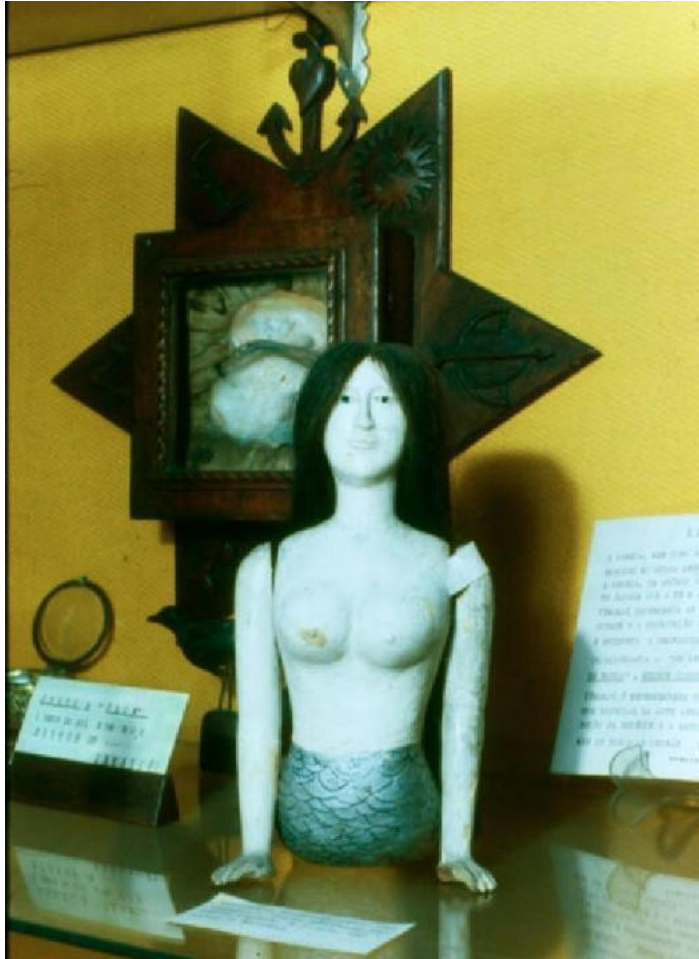
Fotografia 1: Fotografia de Yemanjá.