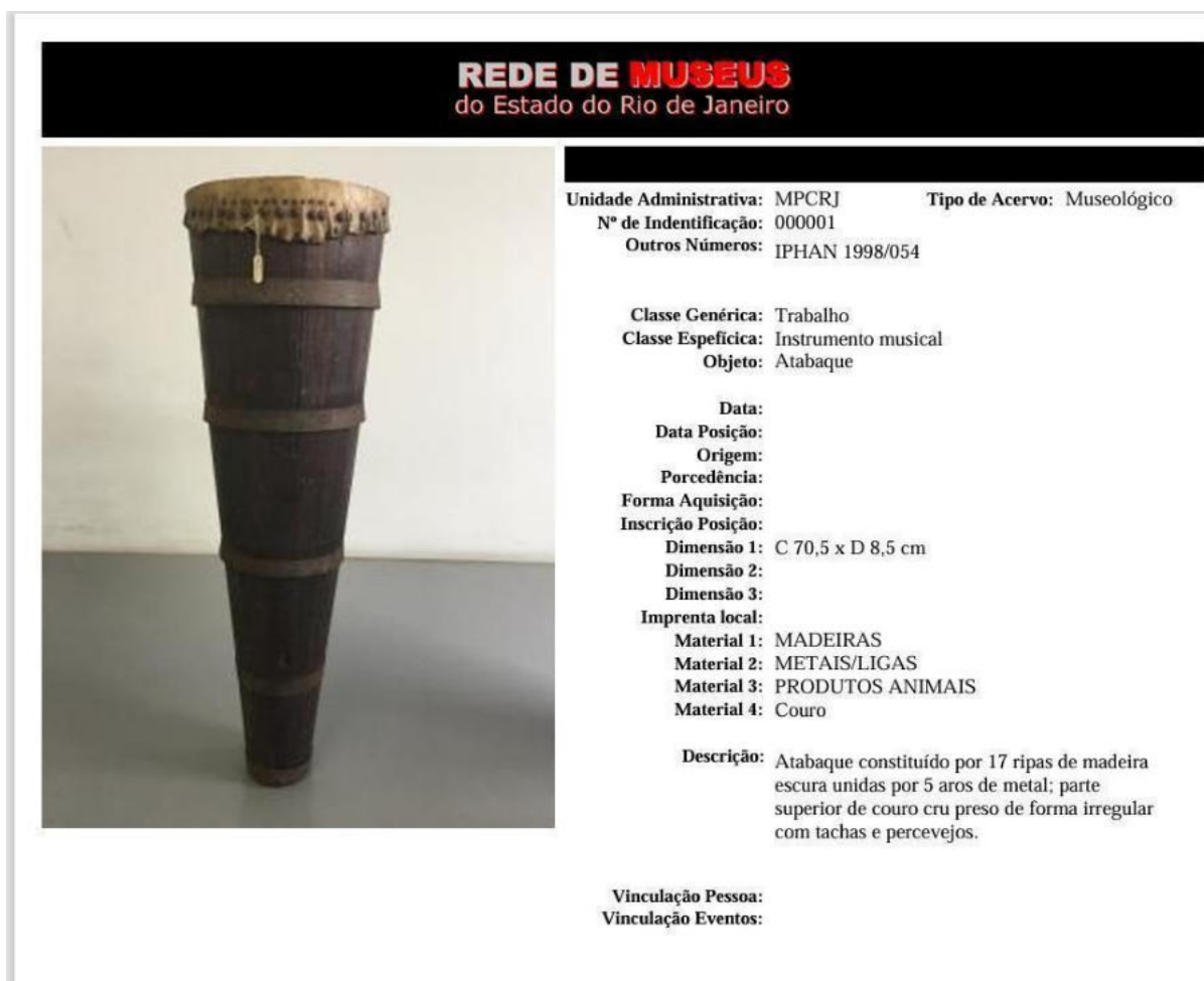
Figura 2 - Imagem com exemplo do modelo de ficha e da catalogação realizada pela Superintendência de Museus.