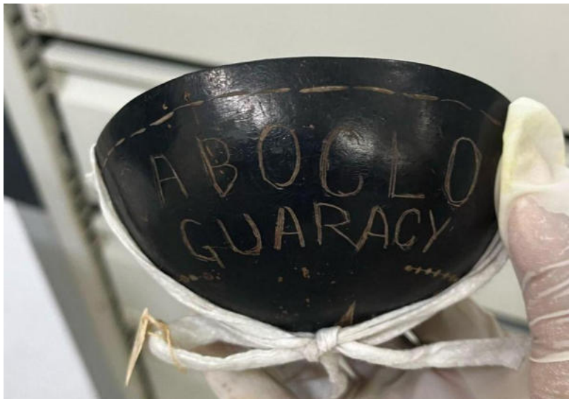
Fotografia 30 - Fotografia de cuia com inscrições em referência ao Caboclo Guaracy.