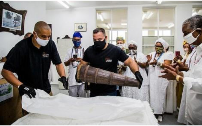
Fotografia 10 e 11 - Imagens do dia da chegada das peças ao Museu da República.