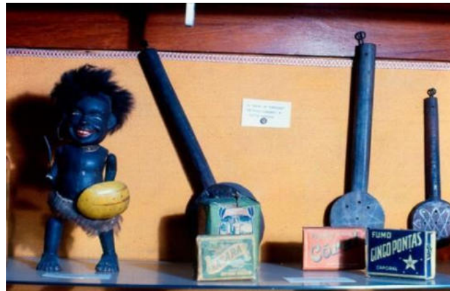
Fotografia 3: Exposição de objetos da coleção no Museu da Polícia.