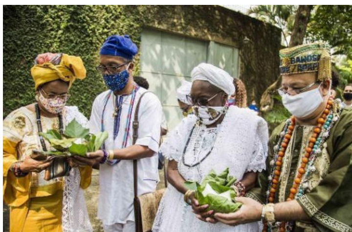
Fotografia 8 e 9

“Por isso, nunca pensaria a Escrevivência como possibilidade de domínio do mundo. Mas como uma pulsação antiga, que corre em mim por perceber um mundo esfacelado, desde antes, desde sempre. E o que seria escrever nesse mundo? [...] Escrevivência, antes de qualquer domínio, é interrogação. É uma busca por se inserir no mundo com as nossas histórias, com as nossas vidas, que o mundo desconsidera. Escrevivência não está para a abstração do mundo, e sim para a existência, para o mundo-vida” (Evaristo, 2020, p.35).