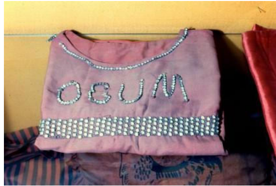
Fotografia 6: Exposição de objetos da coleção no Museu da Polícia.