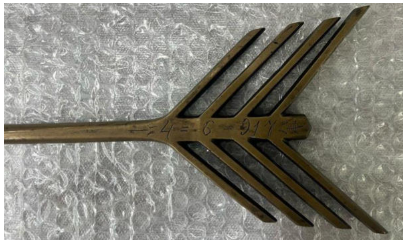
Fotografia 31 - Flecha dourada em metal, com as inscrições “O QUE! FURA PEDRA” (frente) e “4-6-917” (verso). Que provavelmente era usada enquanto uma paramenta do Caboclo registrado na peça.