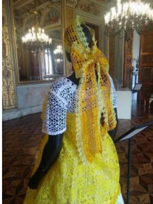
Fotografia 14 - Indumentária de Mãe Meninazinha de Oxum, cedida por empréstimo a exposição temporária.