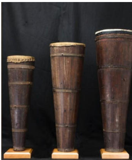
Fotografia 14 - Imagens das estruturas que foram construídas para sustentação dos atabaques.