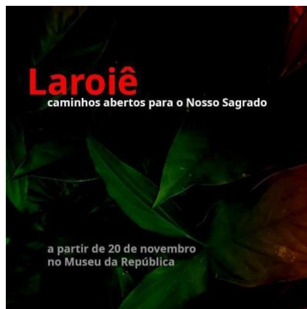
Figura 1 - Imagem de divulgação da exposição “Laroiê: Caminhos Abertos”.

acerca desse Orixá 34 e contemplar a sua representatividade na coleção e nos cultos das religiões afro-brasileiras. Além desses banners, a exposição ganhou um espaço no hall principal do Museu, uma escultura representando a cabeça de Exu Ijelu/Caboclo Lalú 35 e os acervos doados por Mãe Meninazinha, o abebé e o fio de contas, em conjunto com uma indumentária de candomblé emprestada por ela.