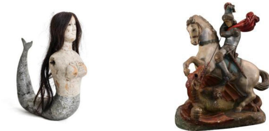
Fotografia 23 e Fotografia 24: Imagem da escultura de Yemanjá e São Jorge.