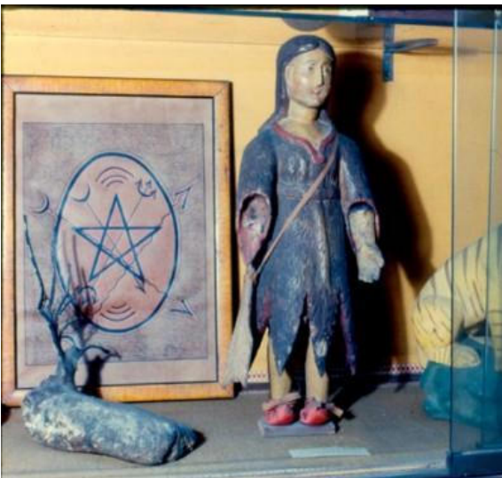
Fotografia 7: Exposição de objetos da coleção no Museu da Polícia.