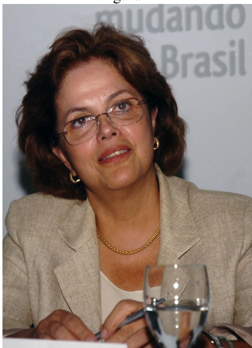
Dilma, ministra-chefe da Casa Civil (2008)