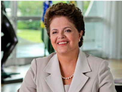
A presidente Dilma Rousseff

Subtítulo da matéria que também poderá ter uma ou mais linhas servido de marcação do tópico