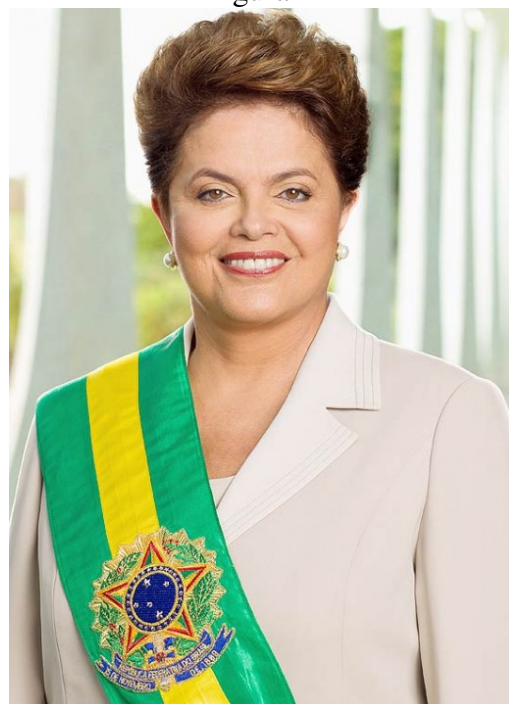
Dilma, presidente da República (2011)

As características que enfraqueciam o poder da candidata de atrair votos foram rapidamente trabalhadas pela equipe de assessores e marqueteiros. Dilma passou por uma grande transformação de seu visual. Seus cabelos ganharam nova coloração e um corte mais moderno, e seus dentes foram clareados. Os óculos pesados, antes utilizados durante eventos oficiais, foram trocados por lentes de contato. A então ministra da Casa Civil também passou por intervenções estéticas, nas regiões malar e mandibular 24 , além de outras plásticas no rosto