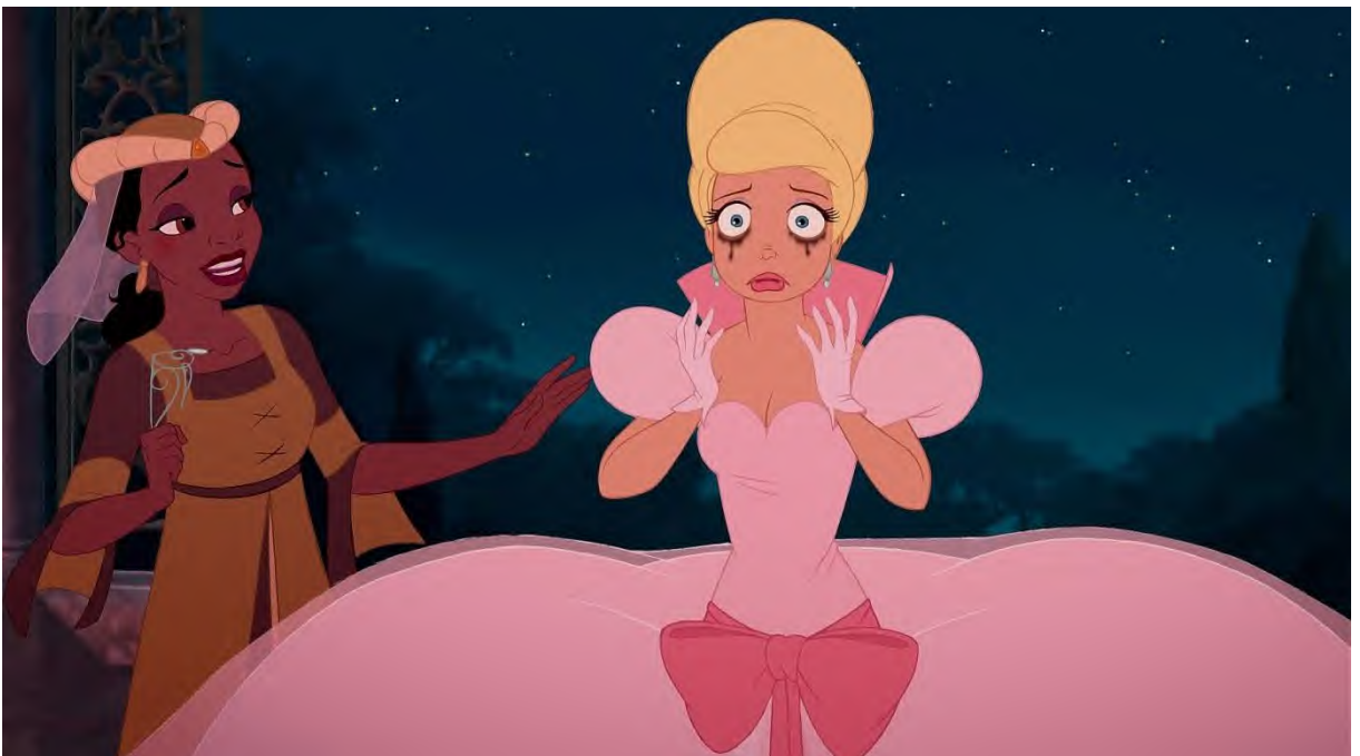
Figura 2. Tiana e Charlotte de “A Princesa e o Sapo”