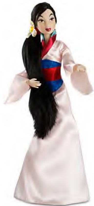
Figura 4. Boneca de Mulan.