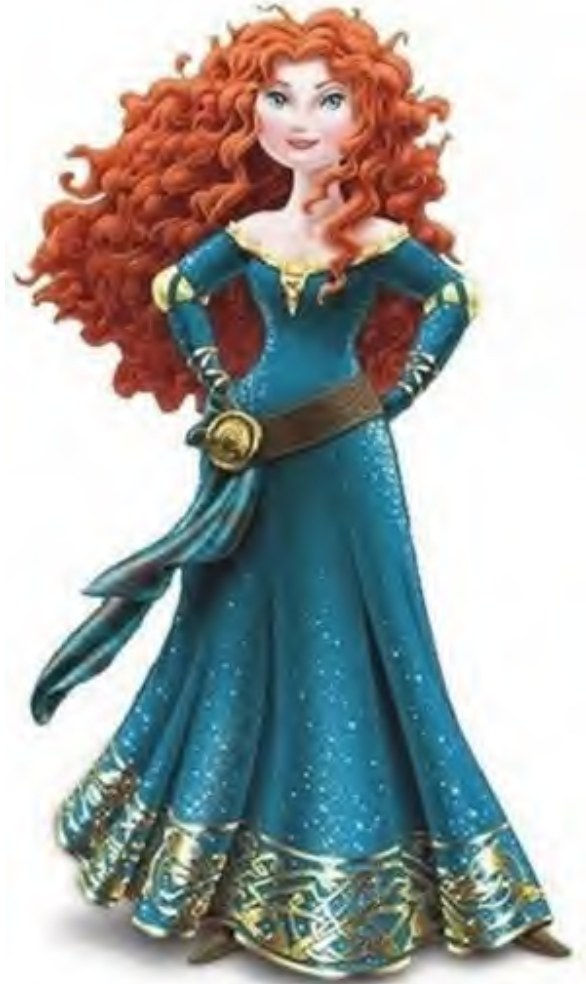
Figura 8. Merida "princesa"