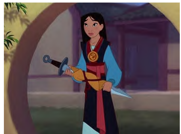
Figura 6. Azul no final