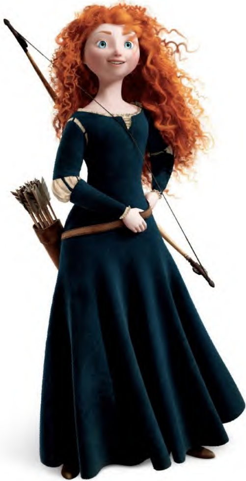
Figura 7. Merida original