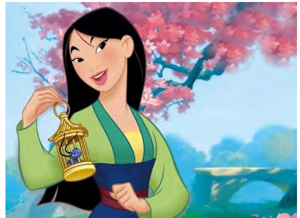
Figura 5. Verde no começo do filme