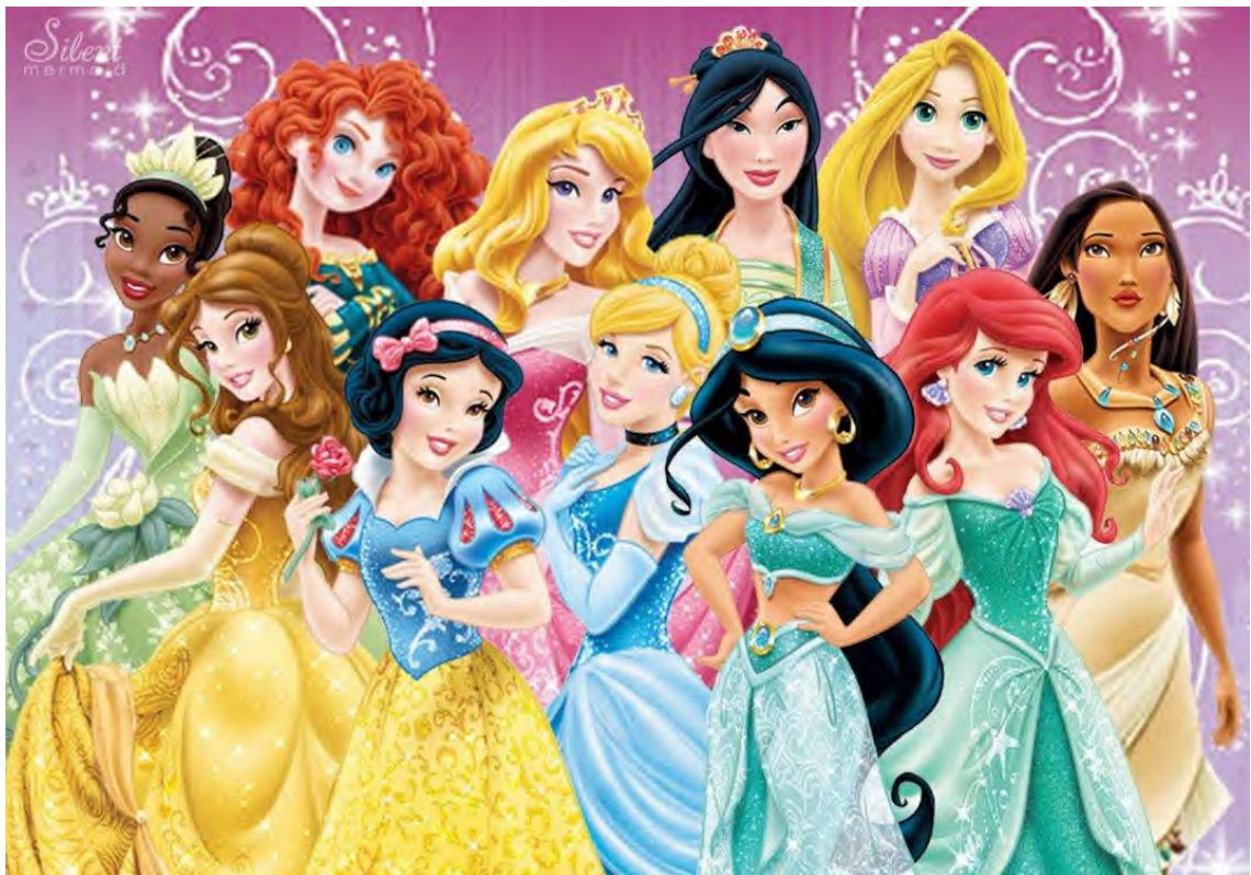
Figura 10. O redesign de 2012