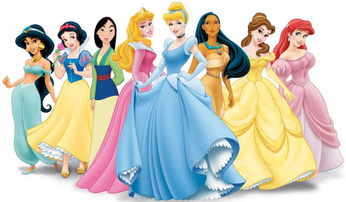
Figura 9. As princesas originais