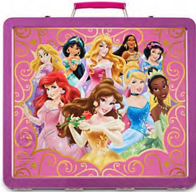
Figura 3. Exemplo de produto da franquia "Princesas"