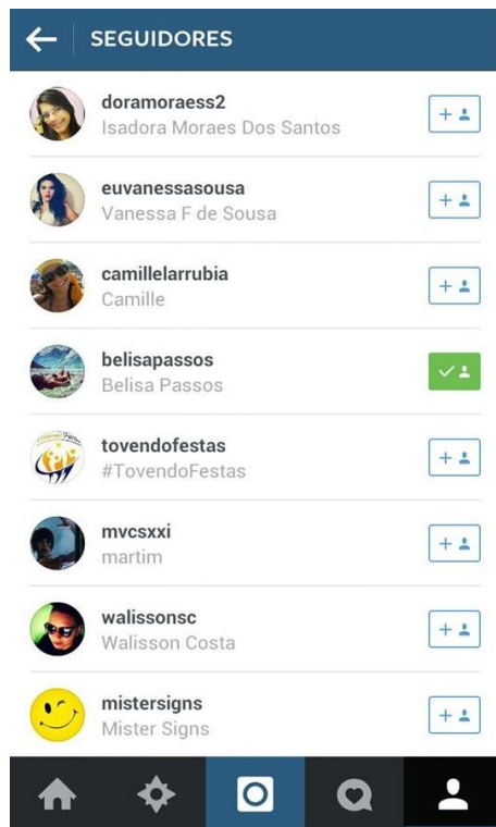
Imagem 3: Seguidores