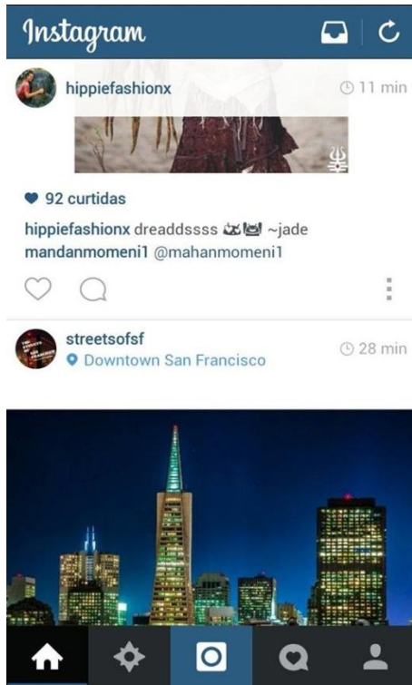
Imagem 1: Timeline