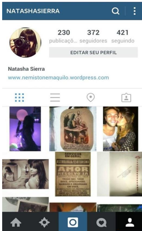
Imagem 2: Perfil